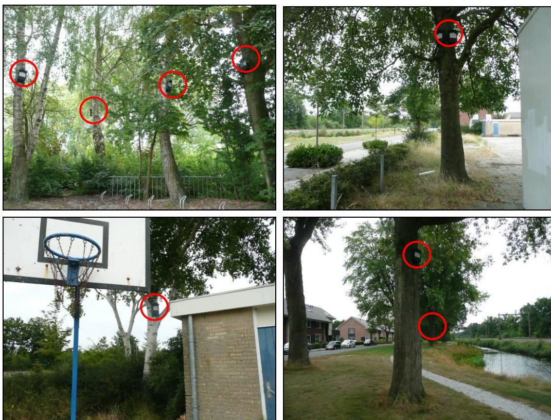
Figuur 5. Enkele van de twaalf vleermuiskasten type Chillo nabij de school.