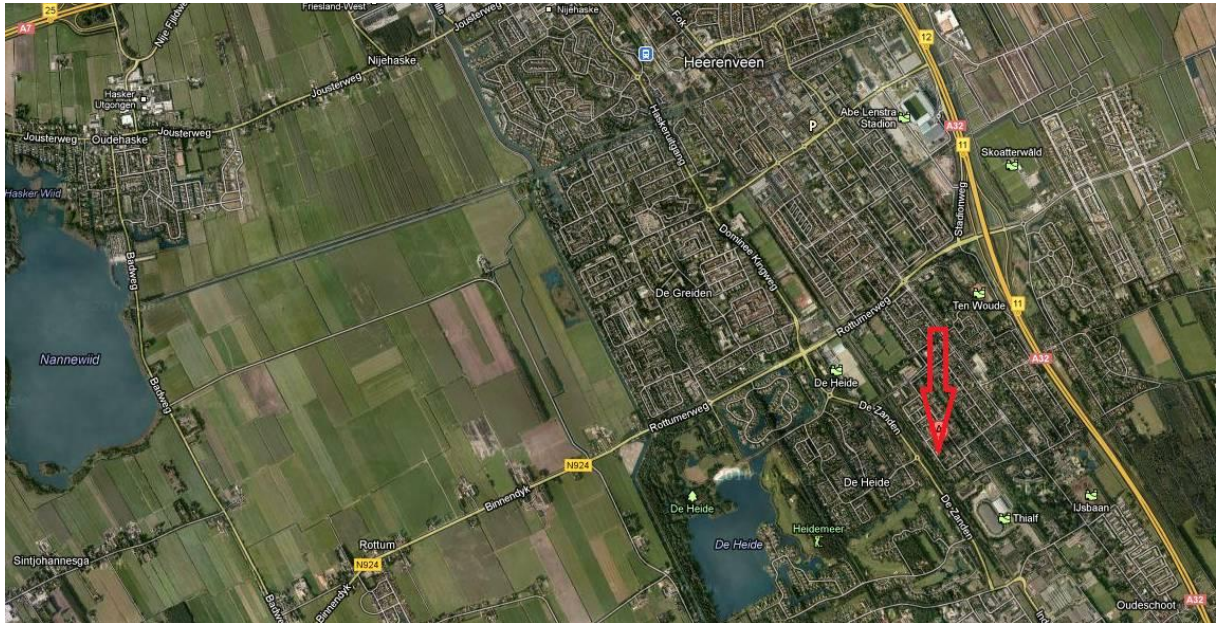
Figuur 1. Ligging van het plangebied (rode pijl).

Het plangebied ligt aan de zuidkant van Heerenveen in de provincie Friesland (zie figuur 1). De school ligt in de Naardermeerstraat middenin een nieuwbouwwijk en is aan 3 kanten omgeven door bebouwing. Alleen aan de westkant van het plangebied (Goollandlaan) is aan de overkant van de straat een groenstrook met daarachter het spoor (figuur 2).