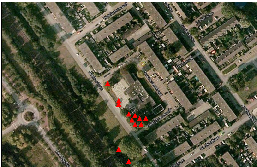
Figuur 4. Een overzicht van de locaties waar vleermuiskasten zijn opgehangen.