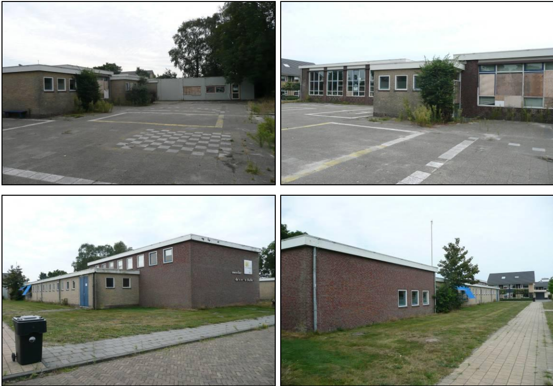
Figuur 3. Een impressie van de basisschool in 2014.