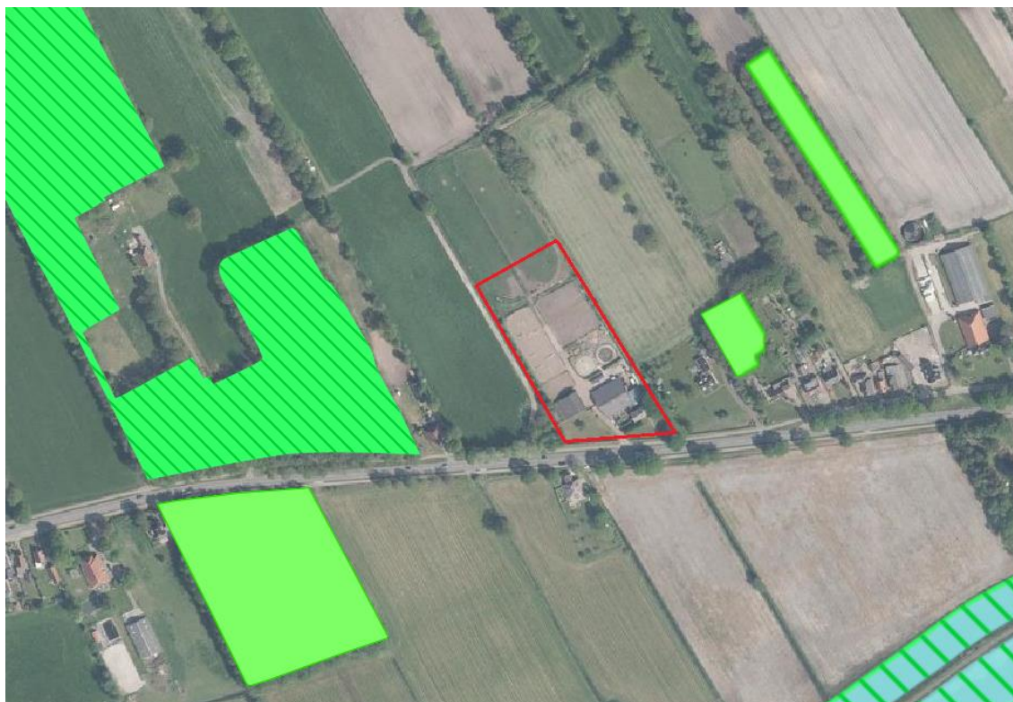
Beschermde gebieden rondom het plangebied (rood). Lichtgroen: Natuur buiten NNN. Groen gearceerd: NNN. (bron kaartondergrond: ruimtelijkeplannen.nl).

In het kader van de Wnb beschermde gebieden liggen op kleine afstand van het plangebied. Het meest nabijgelegen beschermde gebied betreft het Natura 2000-gebied 'Deelen' dat gelegen is op een afstand van circa 10 kilometer ten noordwesten van het plangebied. Het meest nabijgelegen NNN-gebied ligt op circa 130 meter ten westen van het plangebied. Het dichtstbijzijnde gebied dat is aangewezen als 'Natuur buiten het NNN' omvat een bosstrook die op circa 130 meter afstand ten oosten van het plangebied is gelegen. Het meest nabijgelegen weidevogelkansgebied is gelegen op een afstand van circa 2,4 kilometer ten zuidwesten van het plangebied.