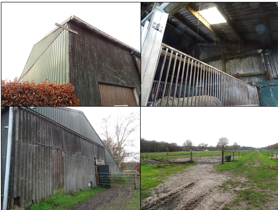
Foto's 1 t/m 4. Impressie van de te slopen paardenstal en het plangebied op 4 december 2019. Linksonder het aanzicht op de zuidoostzijde van de te slopen paardenstal. Rechtsboven de binnenkant van de te slopen paardenstal. Linksonder het aanzicht op de noordzijde van de te slopen paardenstal. Rechtsboven het aanzicht op de noordzijde van het plangebied.