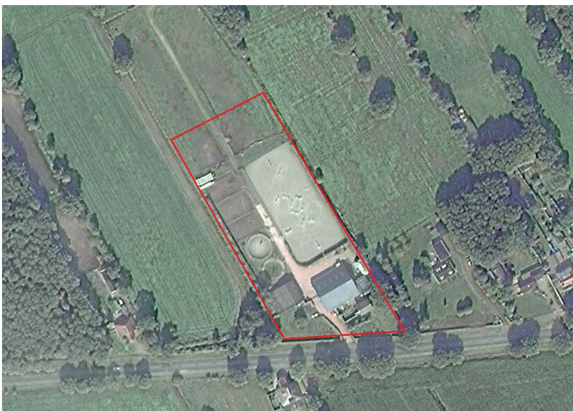
Figuur 1. Topografische kaart met de locatie van het plangebied (rood).

De ontwikkelingen bestaan uit de realisatie van een binnenrijbak met stalling aan de westzijde van het plangebied. Hiervoor wordt de westelijke paardenstal gesloopt. Daarnaast wordt de buitenrijbak aan de oostzijde van het gebied uitgebreid. Ten zuiden en westen van de te realiseren binnenrijbak met stalling wordt verharding aangelegd. Daarnaast wordt ten zuiden van de binnenrijbak een parkeerplaats gerealiseerd. De twee huidige longermolens zullen worden verwijderd en opnieuw worden aangelegd tussen de woning met paardenstal en de buitenrijbak. Aan de woning met paardenstal worden geen werkzaamheden verricht. Voor de ontwikkelingen wordt grond vergraven en deels vegetatie verwijderd. De beukenhagen rondom het plangebied worden behouden, maar de haag die aan de zuidzijde van de buitenrijbak staat, wordt verwijderd.