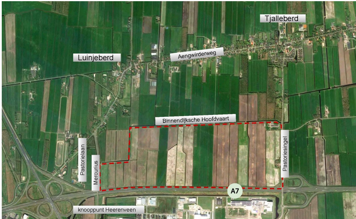
Afbeelding 1: Plangebied

Aan de noordzijde van de A7, tegenover het bedrijventerrein IBF Heerenveen ligt het gebied Klaverblad Noordoost (KNO). Het gebied met een omvang van meer dan 120 ha wordt aan de noordzijde begrensd door de Binnendijkse Hoofdvaart, aan de westzijde door de Mercurius en aan de oostzijde door de Pastoriesingel. De gemeente Heerenveen wil het gebied ontwikkelen door een bedrijventerrein, zonnepark en natuurinclusieve landbouw samen te brengen in een integraal plan. Het plan is gericht op het realiseren van een kwalitatief hoogwaardige, integrale en evenwichtige gebiedsontwikkeling.