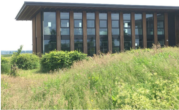
c. Openheid, hout, ritmiek