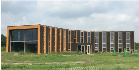
c. Bruin (hout) en antraciet gecombineerd