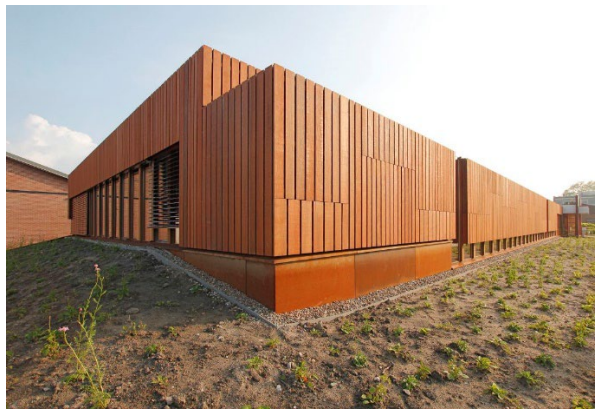
d. Cortenstalen plint, hout