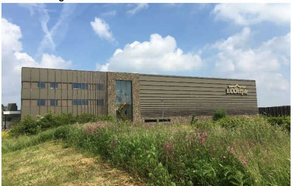
g. Hout, ritmiek