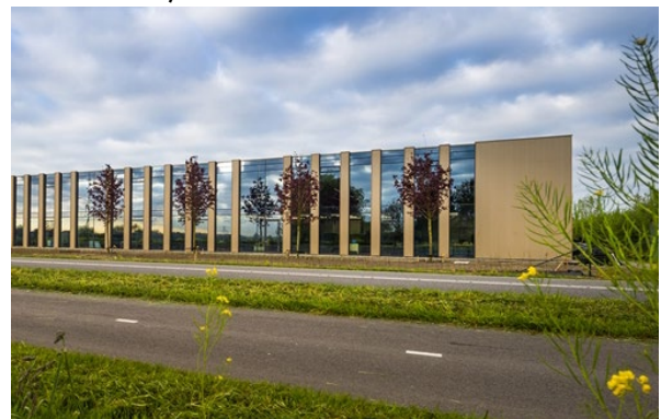
h. Transparant naar A7, ritmiek