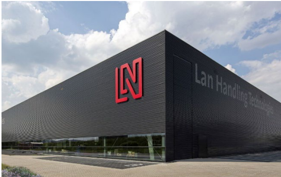
e. orientatie op openbare ruimte door raamstrook