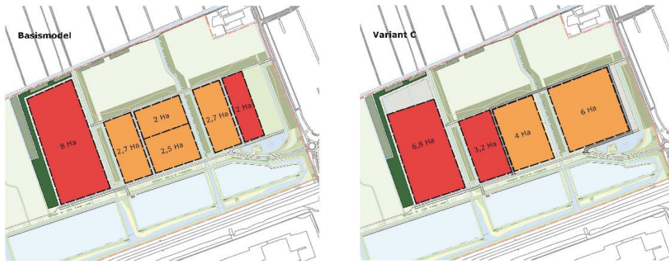
Afbeelding 4: Flexibele invulling fase 2 (2 varianten)

landbouwgrond. Met de ontwikkeling van fase 2 worden ook de bosstroken ten noorden en westen hiervan versterkt.