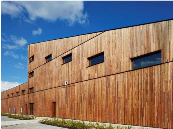
a. Gevels in hout en/of plaatmateriaal in bruin en antraciet