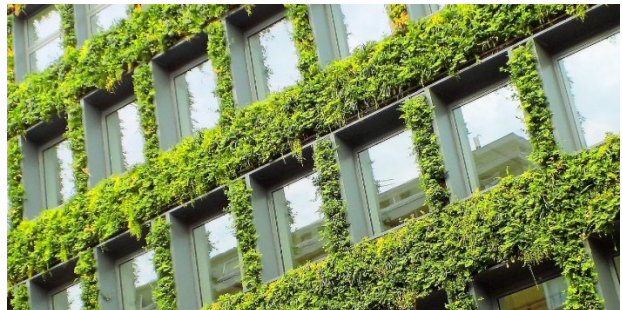
f. Groene gevel