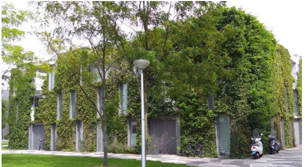
e. Groene gevel