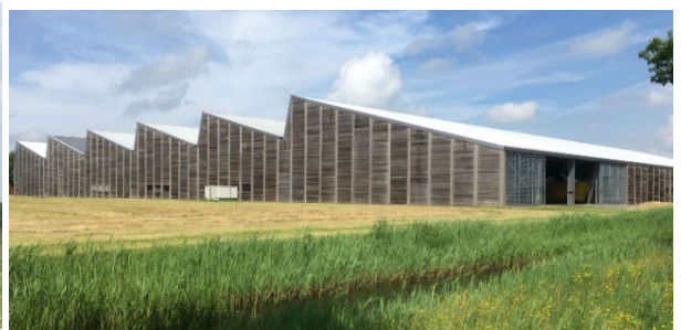
d. Afwijkende kapvorm (sheddak) mogelijk