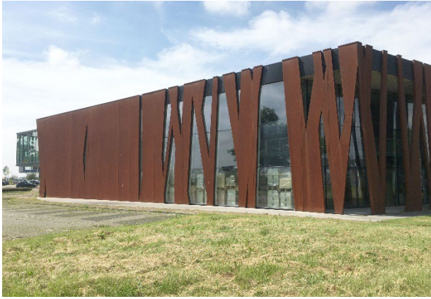
a. Expressie in cortenstaal / verticale geleiding