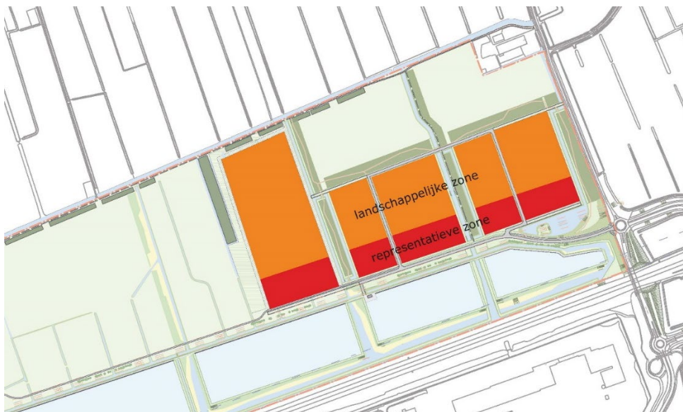
Afbeelding 5. Zonering beeldkwaliteitsplan (inclusief fase 2)

De landschappelijke zone vormt het overige deel aan de noordzijde. Hier moet de inpassing in het landschap, gecombineerd met aspecten van duurzaamheid, tot uitdrukking komen in de verschijningsvorm.