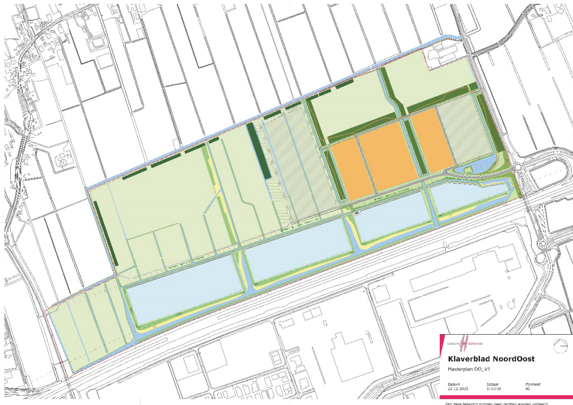
Afbeelding 2: Masterplan

Bosstroken vormen ruimtelijke 'kamers' waarbinnen het bedrijventerrein tot ontwikkeling kan komen, en refereren aan de (ruilverkavelings) bosjes in de omgeving en de 'petbosjes' uit het verleden. De bosstroken zorgen met een breedte van 25 tot 30 meter voor een robuust ruimtelijk kader voor de ontwikkeling van het bedrijventerrein.