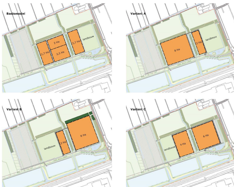
Afbeelding 3: flexibele invulling fase 1 (4 varianten)

Het minimale oppervlak van een bedrijfskavel is 2.000 m 2 (2 hectare).