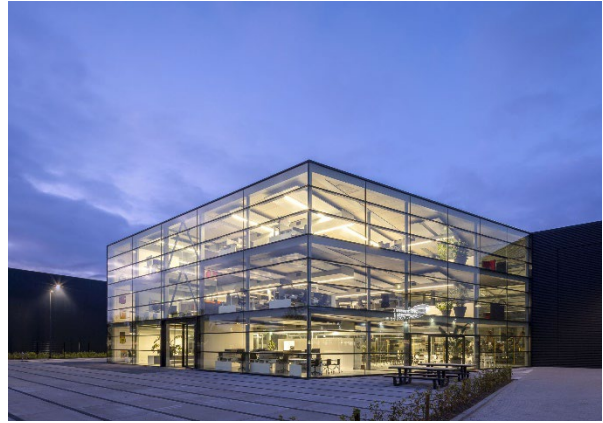
b. Accent in glas