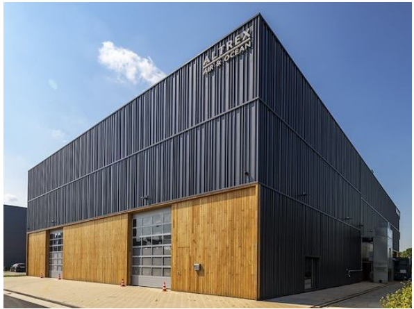
b. Textuur door bijzondere profilering