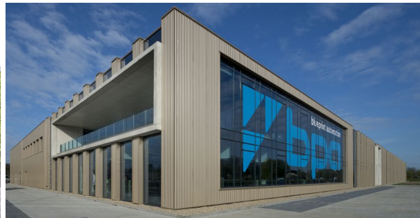
f. Accent, ritmiek