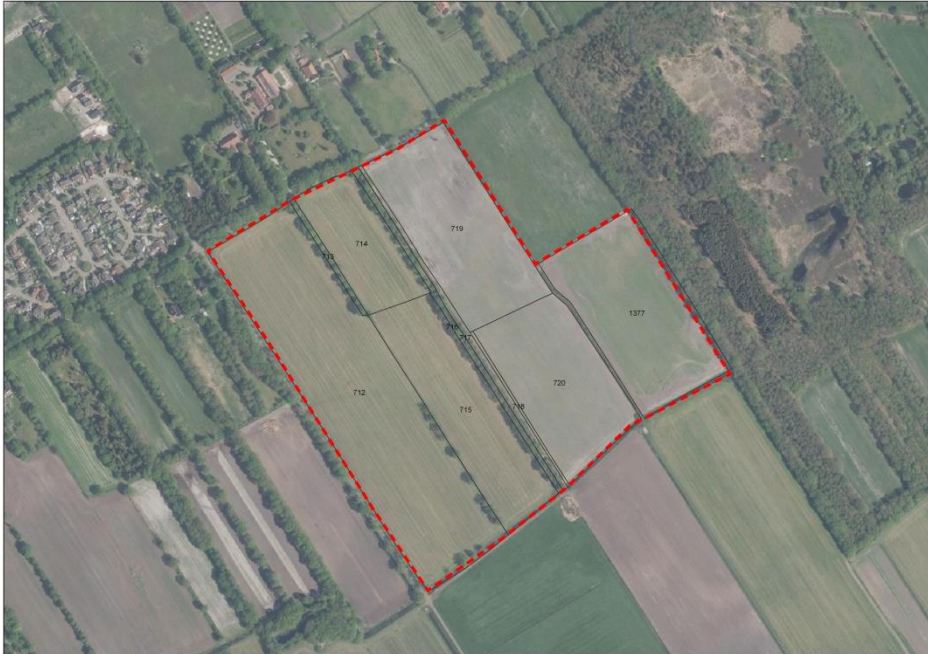
Figuur 1. Omgrenzing plangebied