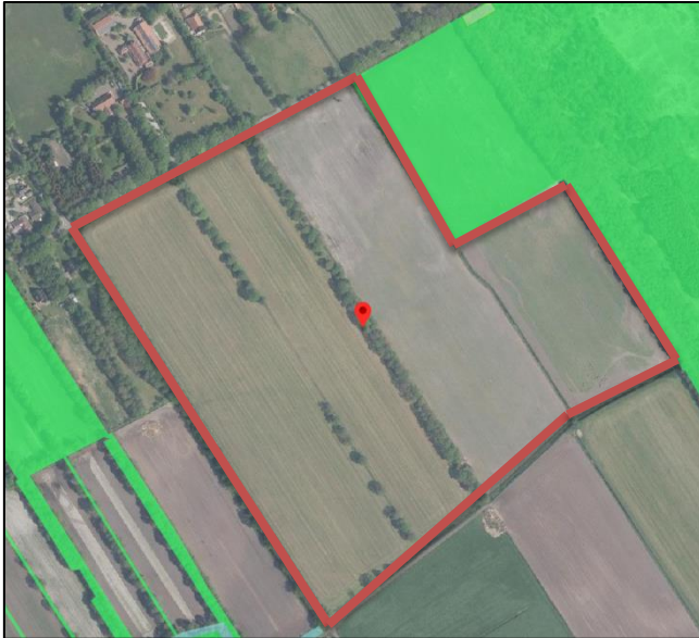
Figuur 3. Het NNN (groen) grenzend aan het plangebied.