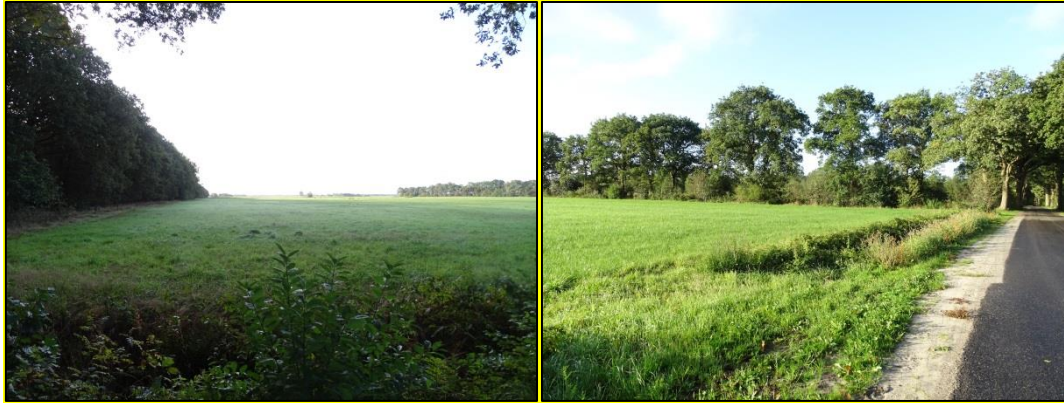
Een impressie van het plangebied gezien richting het zuiden en zuidwesten op 2 oktober 2019