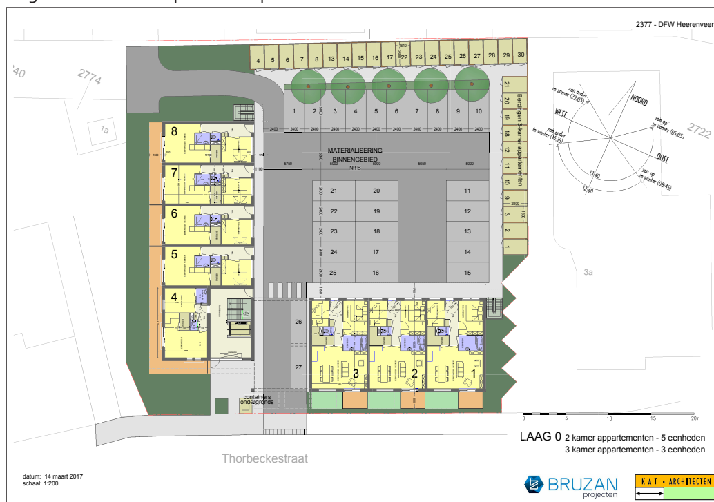
Situatieschets na overleg met aanwonenden

BRUZAN legt het aangepaste plan voor aan de gemeente. Deze rapportage wordt bijgevoegd. Bewoners ontvangen een kopie van deze rapportage. Afgesproken is, dat BRUZAN de aanwonenden informeert wanneer de gemeente met het plan in de openbaarheid komt.