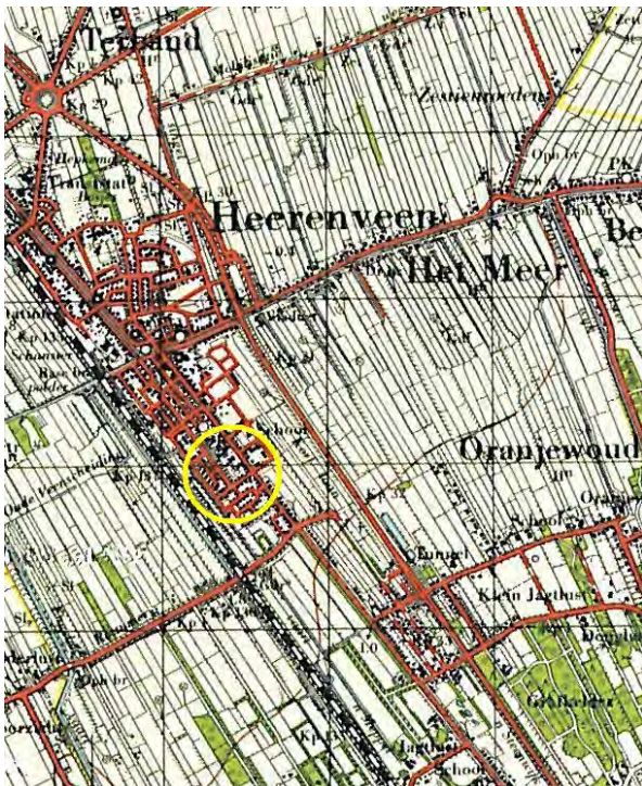
Figuur 3: Heerenveen op de topografische kaart uit 1959. Het onderzoeksgebied ligt binnen de gele cirkel.

Het onderzoeksgebied wordt op de topografische kaart uit 1922 en op 19e eeuwse kaarten weergegeven als strookvormig verkaveld grasland. Op de topografische kaart uit 1959 is het gebied bebouwd zoals tegenwoordig met uitzondering van deelgebied I (zie Figuur 3).