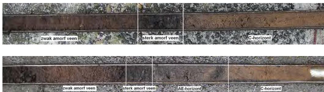
Figuur 5: Boorkernen van boring 39: 1,0 - 1,4 m beneden maaiveld (boven) en boring 59: 1,3 - 1,7 m beneden maaiveld (onder). Bij beide kernen is de linkerkant boven. De breedte van de guts is 2 cm. Ter plaatse van boring 39 heeft nauwelijks bodemvorming plaats gevonden in het zand, ter plaatse van boring 59 wel: humeuze aanrijking en uitspoeling (AE-horizont). Aangezien een duidelijk herkenbare inspoelingshorizont (B) ontbreekt, is van een podzolbodem nog geen sprake.

De overgang van het Pleistocene zand naar het bovenliggende veen is bij driekwart van de boringen intact aangetroffen. Hierbij moet worden aangemerkt dat vooral geboord is in tuinen en openbaar groen. Waarschijnlijk is de zand-veen-overgang algemeen verstoord ter plaatse van bebouwing en straten. De bovenliggende veenlaag is veel sterker verstoord. In de eerste plaats door landbouwkundig gebruik in het verleden, maar nog veel meer door de aanleg van de tegenwoordige wijk.