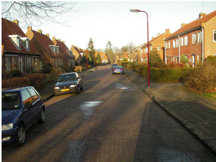
Figuur 2: Heerenveen Midden. Op de bovenste foto de Engelmanstraat (noordoosten van het gebied), op de onderste foto de Halbertsmastraat (zuiden van het gebied).