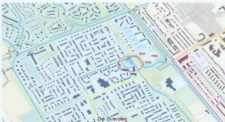
Figuur 1, overzicht plangebied

Op 26 januari 2016 is door u een digitale watertoets doorlopen voor het plan 'Hondsdrif 1' te Heerenveen. Op dit plan is de normale watertoetsprocedure van toepassing. De reden hiervoor is de aanwezigheid van een hoofdwatergang. Deze brief vormt het wateradvies voor het hierboven genoemde plan.