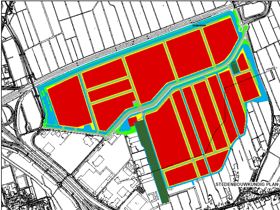
Figuur 2. Stedenbouwkundig plan