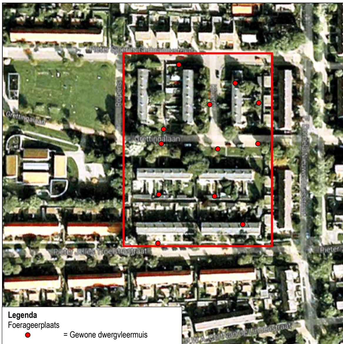
Figuur 2. Foerageerplaatsen van vleermuizen in de voorzomer in het gebied aan de Troelstrastraat e.o. te Harlingen.

In de voorzomer werd één soort vleermuis waargenomen (gewone dwergvleermuis). Deze soorten is foeragerend aangetroffen. Gewone dwergvleermuis komt foeragerend in lage dichtheid voor. Er zijn geen kolonies of vliegroutes aangetroffen. In figuur 2 staan de waarnemingen weergegeven.