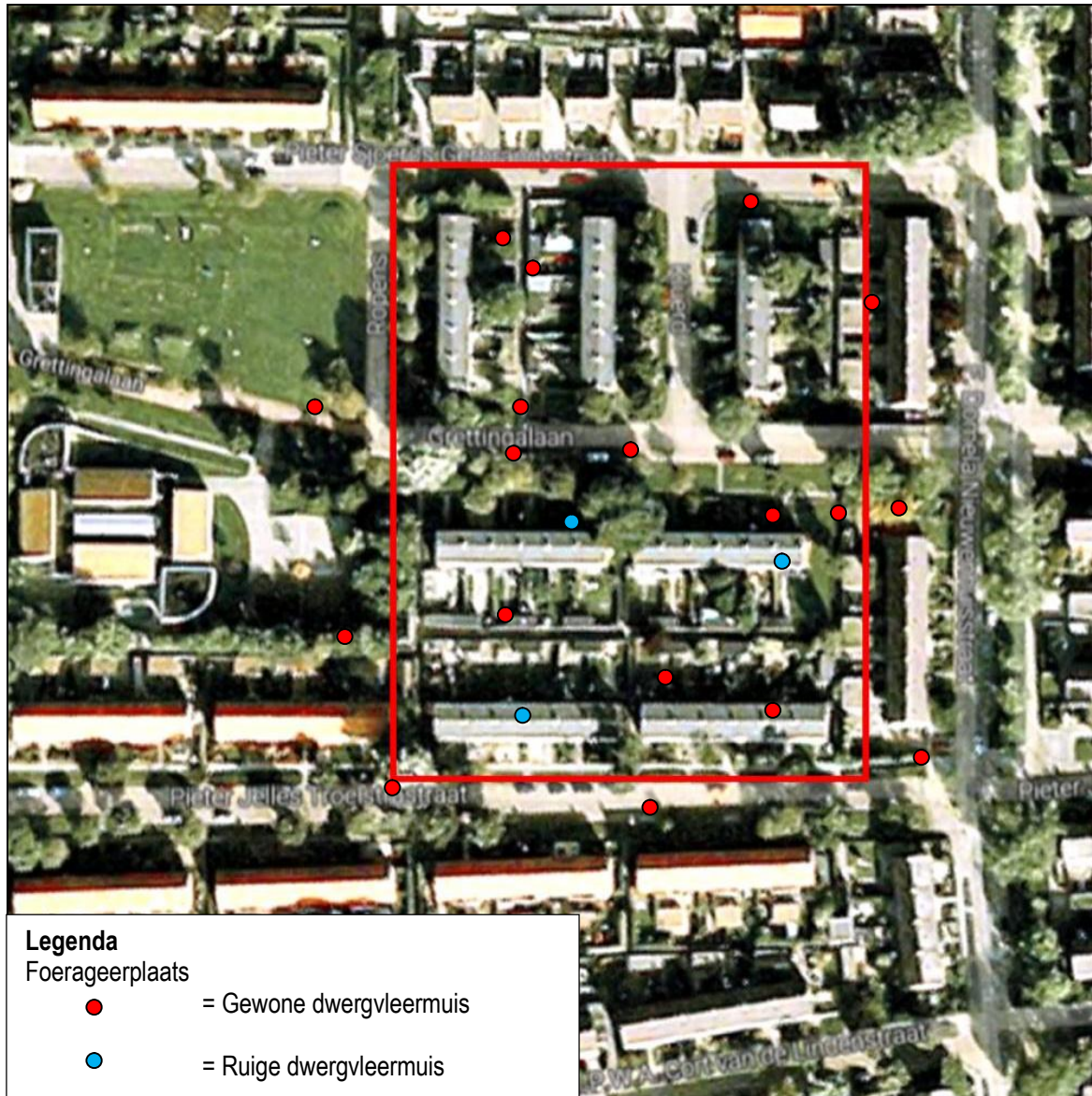
Figuur 3. Foerageerplaatsen van vleermuizen in de voorherfst in het gebied aan de Troelstrastraat e.o. te Harlingen.

Er zijn in de voorherfst gewone en ruige dwergvleermuizen foeragerend aangetroffen. Er zijn geen balts- of paarplaatsen vastgesteld ter plaatse van of direct rond het plangebied. In figuur 3 worden de waarnemingen weergegeven.