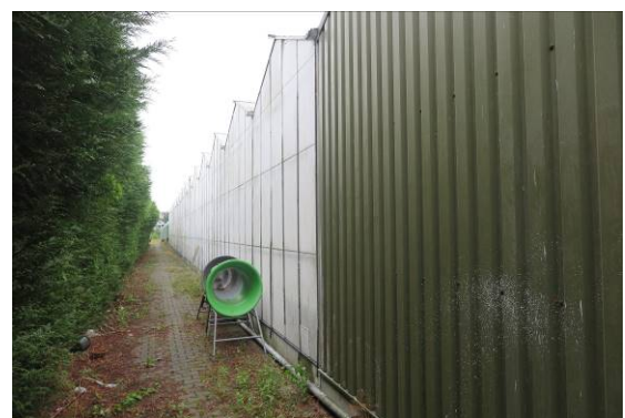
Figuur 2. Foto-impressie van het plangebied aan de Groen van Printsterstraat en Dr. W. Dreesstraat te Harlingen.