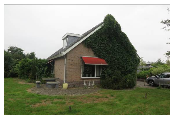
Vervolg figuur 2. Foto-impressie van het plangebied aan de Groen van Printsterstraat en Dr. W. Dreesstraat te Harlingen.