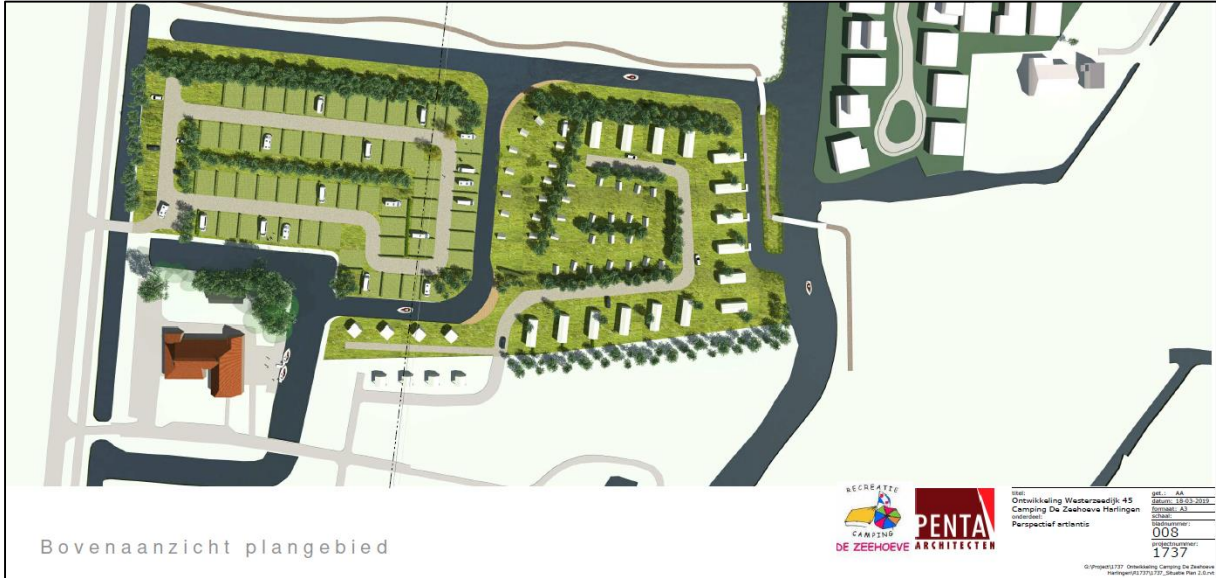
Figuur 1.3. Mogelijk planvoornemen nieuwe situatie.