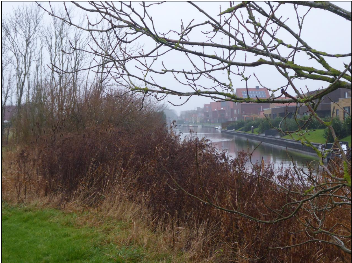
Figuur 2.2. De Bolswardervaart grenzend aan het plangebied als mogelijke vliegroute voor o.a. meervleermuis.