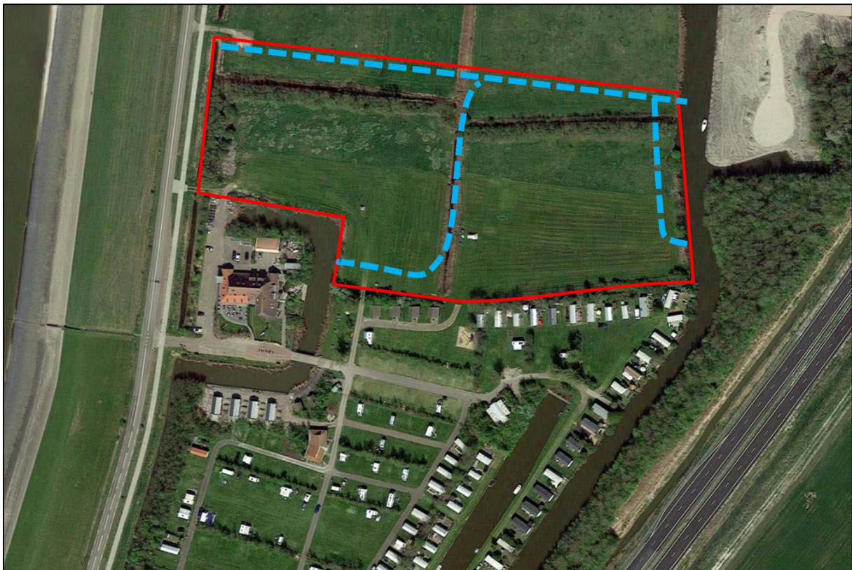
Figuur 1.2. Ligging plangebied (rood kader) en projectie van de nieuwe watergangen (blauwe lijnen).