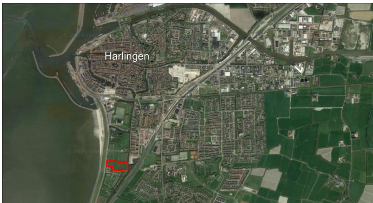
Figuur 1.1. Ligging van het plangebied, rood omrand.

Het plangebied (figuur 1.1) betreft een grasveld ten noorden van camping de Zeehoeve te Harlingen. Het terrein ligt ten zuiden binnen de bebouwde kom van Harlingen en wordt omringd door bomenrijen en smalle en vooral schijnbaar doodlopende sloten. Het grasveld wordt opgesplitst door eveneens een smalle schijnbaar doodlopende sloot. Het planvoornemen is de camping uit te breiden met het grasveld dat het plangebied vormt (figuur 1.2 en 1.3). Daarnaast zullen er verbindende watergangen worden gerealiseerd om de bestaande sloten te verbinden met de Bolswardervaart. Deze bestaande sloten zullen tevens worden verbreed en verdiept. Verder zullen de noordelijk en noordoostelijke gepositioneerde bomenrijen worden gekapt en herplant om als nieuwe afscheiding van het terrein te dienen.