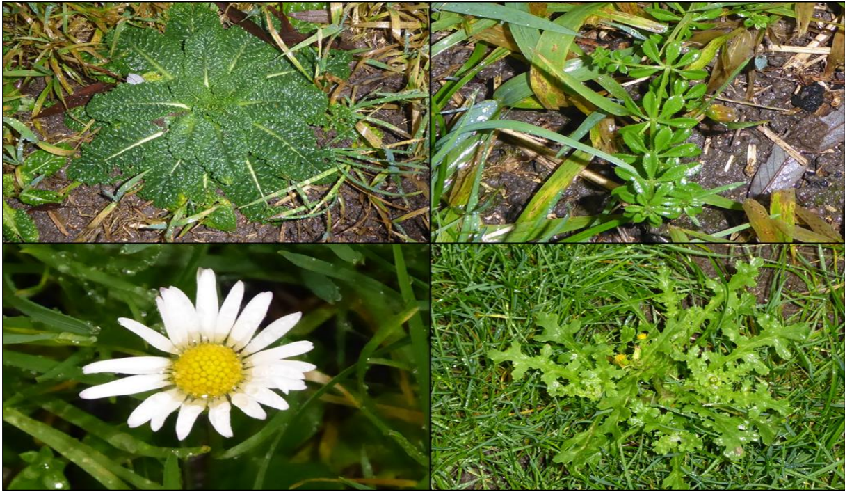
Figuur 2.1. Impressie aangetroffen flora binnen het plangebied.

Het plangebied wordt gekenmerkt door kruidenrijk grasland met soorten zoals Engels raaigras, ridderzuring, paardenbloem, hondsdrif, madelief, paardenbloem, kleeftkruid, riet en andere soorten die gebonden zijn voedselrijke pioniersomstandigheden (figuur 2.1). Het plangebied is vanwege habitateigenschappen ongeschikt voor beschermde flora welke vaak gebonden zijn aan voedselarmere omstandigheden en deze zijn ook niet aangetroffen.