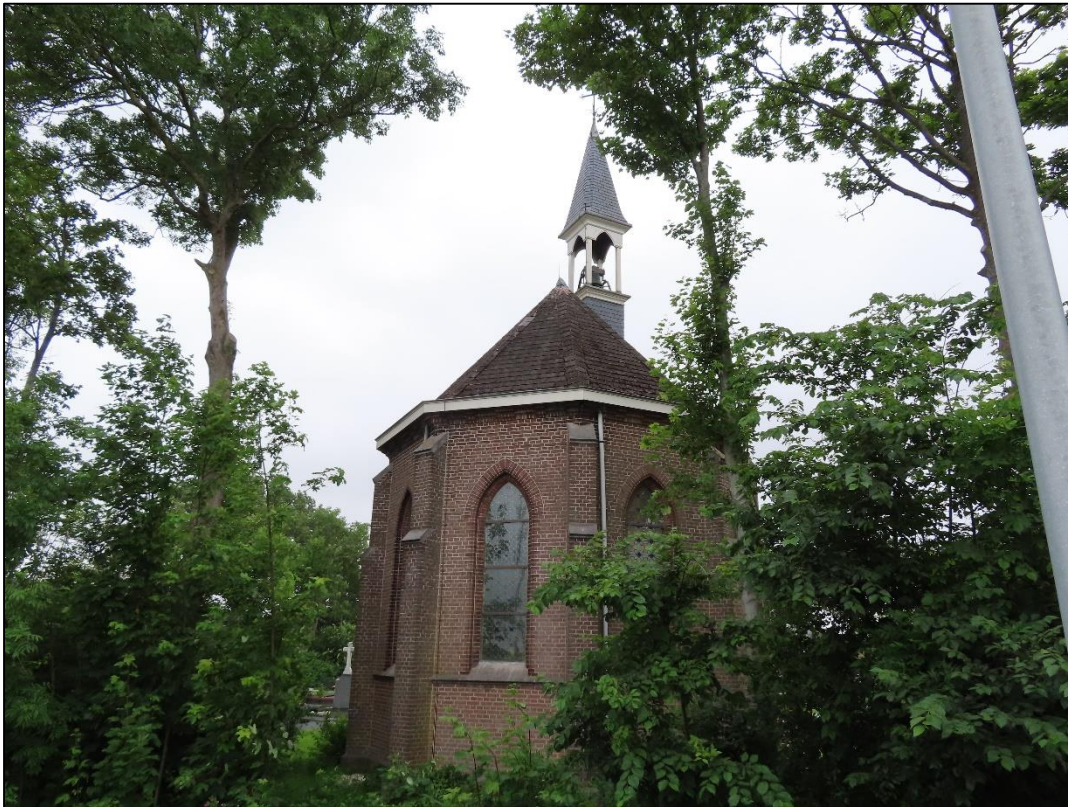
Figuur 3. De kapel welke noordelijk aan het plangebied grenst.

De aanwezigheid van verblijfplaatsen van vleermuizen in deze kapel kan naar ons inzien niet op voorhand worden uitgesloten.