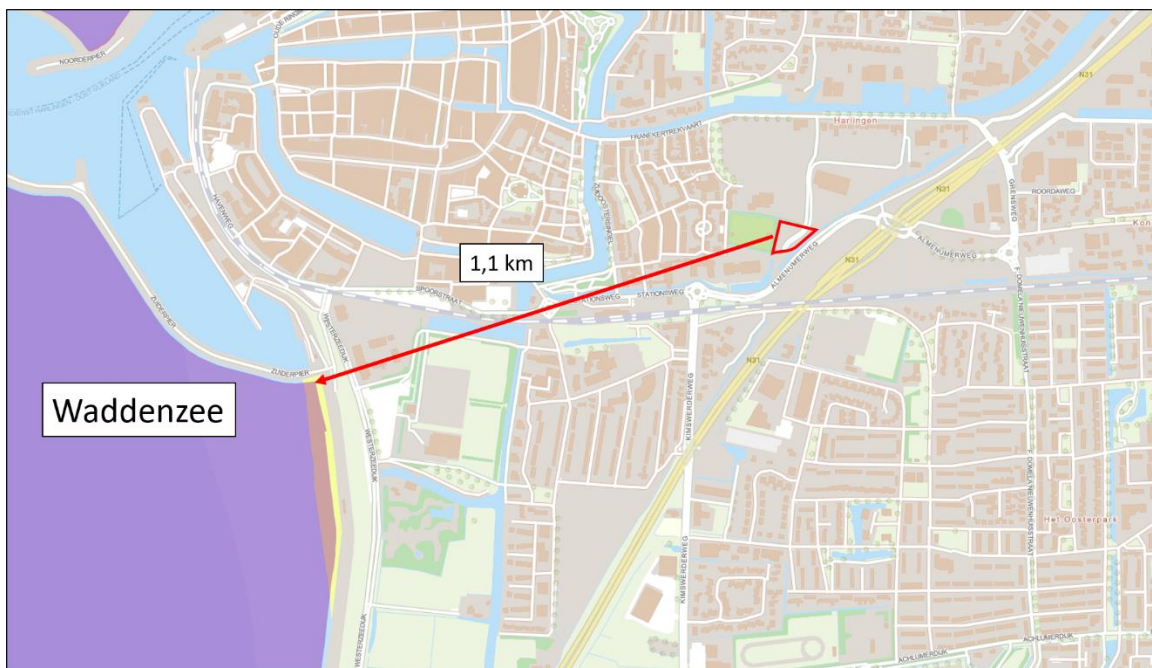
Figuur 4: Het meest nabijgelegen Natura2000-gebied (paarse vlak) ten opzichte van het plangebied (rood omlijnd).

Het dichtstbijzijnde Natura2000-gebied in de omgeving van het plangebied is Waddenzee, welke zich op ca. 1,1 km van het plangebied bevindt (figuur 4). Tijdens de uitvoering van de voorgenomen werkzaamheden komt er waarschijnlijk extra stikstof vrij, door bijvoorbeeld het inzetten van mobiele werktuigen.