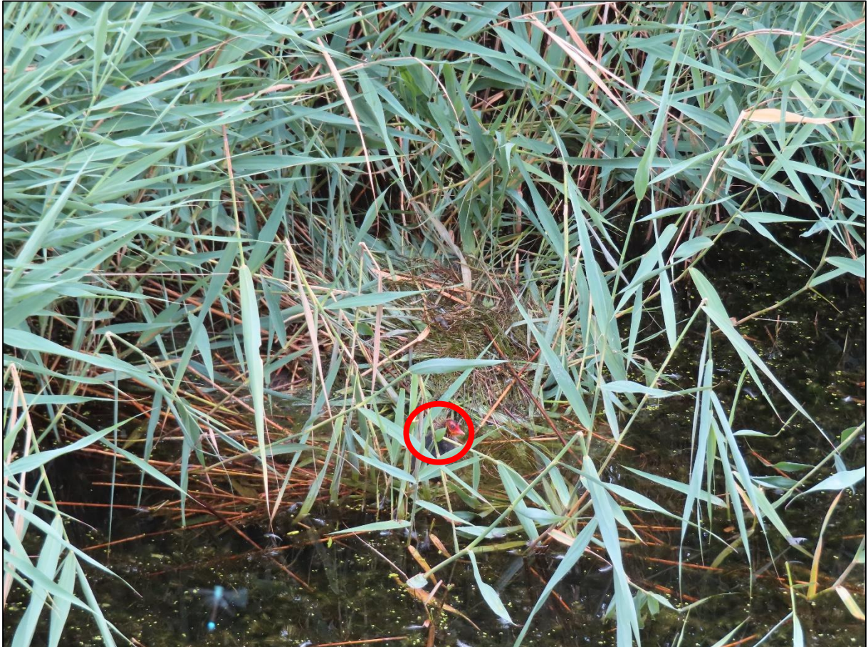
Figuur 2. Een meerkoet nest met een juveniele vogel.

Binnen en vlak buiten het plangebied, maar binnen de invloedssfeer van de werkzaamheden kunnen vogels tot broeden komen waarvan de nesten geen jaarronde bescherming genieten, maar wel beschermd zijn tijdens het broedproces. In de sloot aan de noordoostzijde van het plangebied is ten tijde van het veldbezoek een meerkoet nest aangetroffen. De oudervogels en een juveniele vogel bevonden zich gedurende het bezoek rond het nest (figuur 2). Hoewel deze vogels hier op dit moment zijn uitgebroed, kunnen de vogels opnieuw een legsel produceren. Hiernaast kunnen soorten als houtduif tot broeden komen in de bomen op de begraafplaats die noordelijk aan het plangebied grenst.