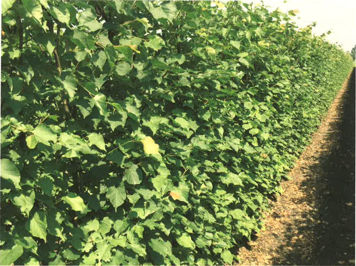
Beeld van een lindehaag, soort is de Tilia cordata = kleinbladige linde, inheems in Nederland

De stenen muur bij het woonhuis tuingedeelte vervangen door een brede stevige lindehaag. In deze robuuste haag kan een HERAS hekwerk geplaatst worden om zodoende doortreding te voorkomen.