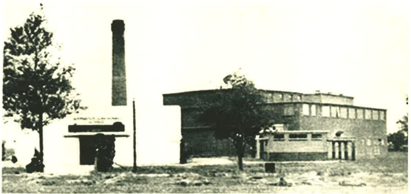
Flaekfabryk „De Zudhoek” en waermazettekstortery „De Vogel” yn de Sudhoek fan St. Anne