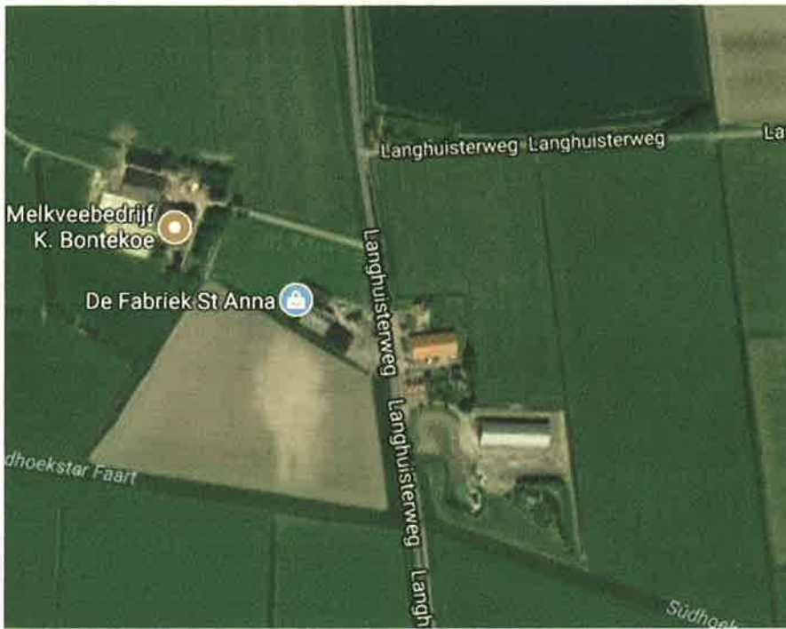
Google Maps aerial view

kadastraal - Sint Annaparochie / sectie F / 865