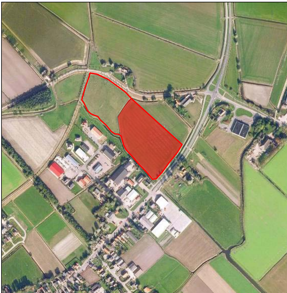
Figuur 1. De ligging van het plangebied

Het onderhavige bestemmingsplan 'Minnertsga Bedrijventerrein Boskdykje fase 3' voorziet in een juridisch-planologische regeling voor de derde fase van het bedrijventerrein Boskdykje. Deze locatie is gelegen aan de Hermanawei ten noorden van het dorp Minnertsga.