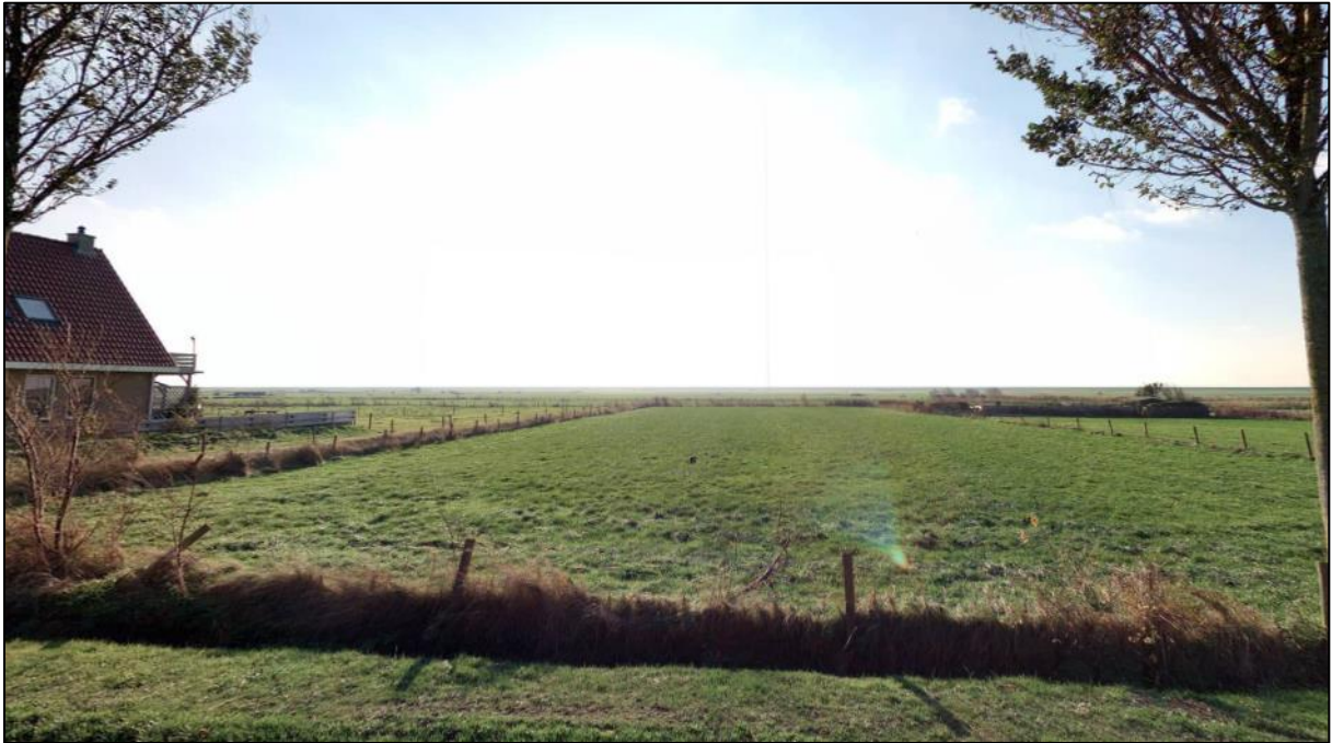
Figuur 1 Agrarisch perceel bestemd voor woningbouw.

Ten behoeve van de nieuwbouw van een vrijstaande woning is bij de gemeente een aanvraag ingediend tot het vaststellen van een bestemmingsplan. Het gaat om een perceel dat op dit moment voor agrarische doeleinden wordt gebruikt aan de Pastoor Scholtenweg in Buren (kadastraal bekend gemeente Nes, sectie F, nummer 905)