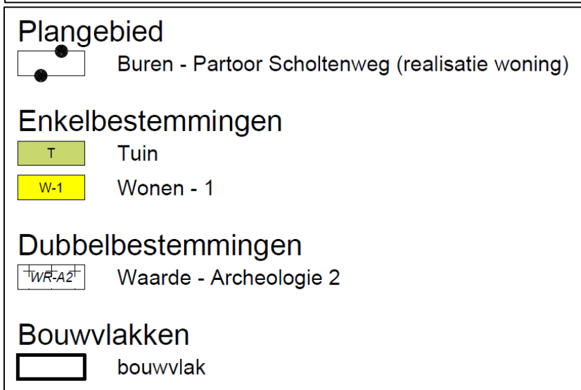
Figuur 4 Kaart met weergave van het toekomstig planologisch regime