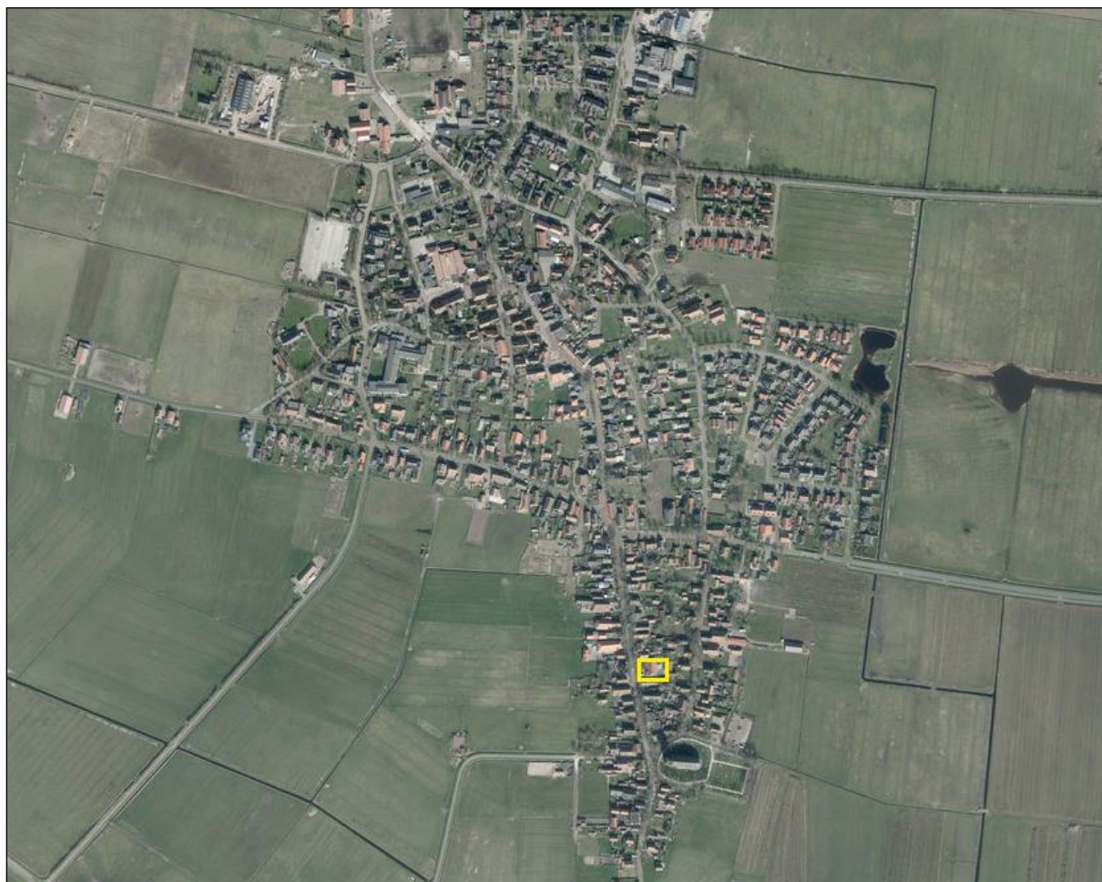
Figuur 3 Situering plangebied in het dorp Hollum.

Het plan is gesitueerd aan de Burenlaan 16 in Hollum, het meest westelijk gelegen dorp van de vier dorpen op Ameland.