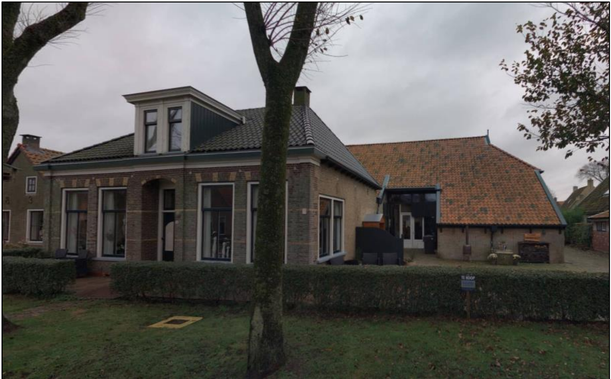
Figuur 1 Bestaande bebouwing (oostzijde). Bron: Maps.google.nl

Bij gemeente Ameland is een verzoek ingediend om een verblijfsrecreatieve bestemming om te zetten in een woonbestemming aan de Burenlaan 16 in Hollum. Het pand heeft op dit moment de bestemming Recreatie-verblijfsrecreatie 2 waarbinnen recreatieappartementen mogelijk zijn. Het is de bedoeling dat de recreatiebestemming volledig komt te vervallen en dat het hele pand als woning in gebruik mag worden genomen.