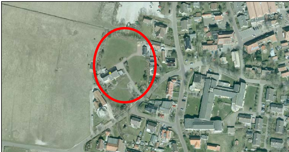
Figuur 1. Situatie Molenweg 6

Op 9 oktober 2013 (ondertekend op 21 november 2013) is een verzoek ontvangen voor een bestemmingswijziging ten behoeve van de bouw van twee woningen op het perceel aan de Molenweg 6 in Hollum. Het perceel heeft in het geldende bestemmingsplan 'Hollum 2009' de bestemming 'Recreatie- Verblijfsrecreatie 2 (R-VR2)'. Op het perceel is tevens een 'bedrijfswoning' aangeduid en aanwezig. Op 14 juli heeft de gemeenteraad besloten het college opdracht te geven een nieuw bestemmingsplan ex artikel 3.1 Wet ruimtelijke ordening (Wro) voor te bereiden voor de bouw van twee woningen op het perceel aan de Molenweg 6 te Hollum. Onderhavige herziening betreft het wijzigen van de recreatieve bestemming in een woonbestemming op een gedeelte van het terrein, zodat woningbouw kan plaatsvinden.