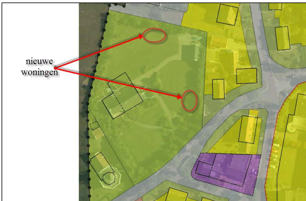
Figuur 4. Situering gewenste ligging twee woningen

De initiatiefnemer verzoekt om een nieuw bestemmingsplan ten behoeve van de bouw van twee woningen op het perceel aan de Molenweg 6.