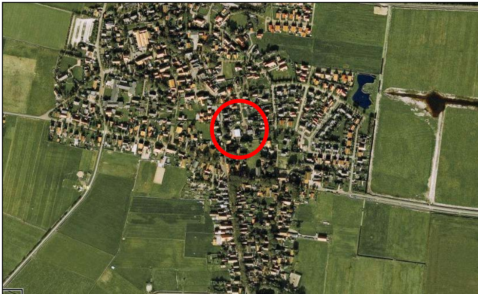
Figuur 1. De ligging van het plangebied

In het bestemmingsplan Hollum 2009 is voor een bedrijfslocatie aan de Schoolstraat in Hollum een wijzigingsbevoegdheid opgenomen om hier woningbouw mogelijk te maken. Figuur 1 geeft de globale ligging van het plangebied weer. Van deze wijzigingsbevoegdheid is twee keer gebruik gemaakt. Ten eerste is door het college van Burgemeester en Wethouders op 22 juni 2010 een wijzigingsplan vastgesteld om één woning aan de Oostakkers 10 mogelijk te maken. Deze woning is inmiddels gerealiseerd. Op 15 februari 2011 is opnieuw een wijzigingsplan vastgesteld, eveneens om de bouw van een woning op het bedrijfsperceel mogelijk te maken. Het betreft het perceel Oostakkers 8, ten noorden van de reeds gerealiseerde woning.