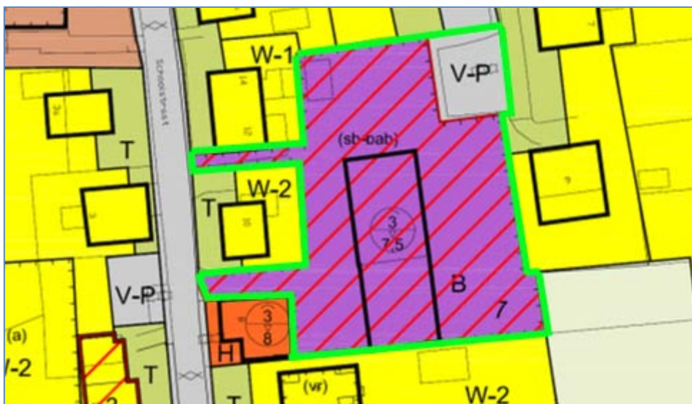
Figuur 2. Uitsnede bestemmingsplan Hollum 2009 met daarin aangegeven de grens van dit bestemmingsplan (groene lijn)

In het geldende bestemmingsplan Hollum 2009 is voor het perceel Schoolstraat 8a de bestemming "Bedrijf" opgenomen. Het perceel heeft de aanduiding "specifieke vorm van bedrijf - bouw c.q. aannemersbedrijf". In het bestemmingsplan is de mogelijkheid opgenomen om het gehele perceel te wijzigen naar een woon- en tuinbestemming. De bedoeling is het bedrijfsperceel gefaseerd te herontwikkelen. Op termijn is het de bedoeling dat het perceel volledig wordt herontwikkeld naar een woonfunctie. Onderstaande figuur is een uitsnede van de verbeelding van het bestemmingsplan Hollum 2009 , met daarop het bedrijfsperceel.