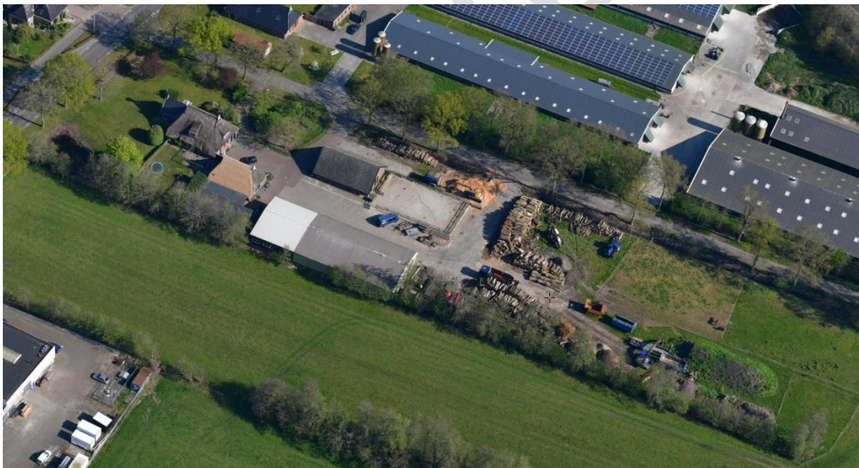
Perceel Koartwâld 8 te Surhuizum

Op dit moment is het perceel waar de opslag zich plaats houdt een agrarische bestemming. Maar is feitelijk al jaren in gebruik voor opslag. Binnen het bestemmingsplan is echter het wijzigen van een agrarische bestemming naar een bedrijfsbestemming ten behoeve van de uitbreiding van een bestaand bedrijf mogelijk. Middels deze wijzigingsprocedure kan de beoogde uitbreiding mogelijk worden gemaakt.