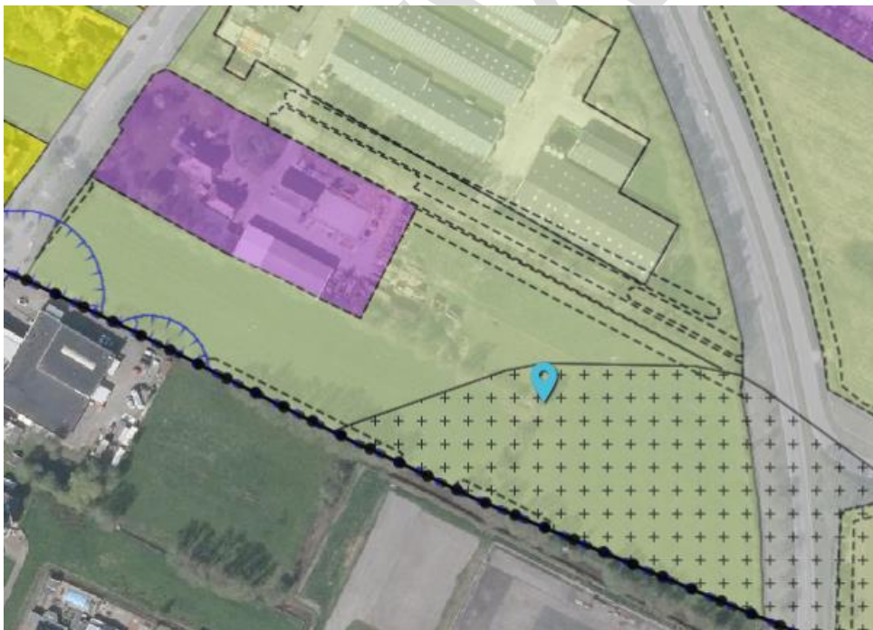
Uitsnede geldend bestemmingsplan perceel Koartwâld 8 te Surhuizum

In dit geval valt +/- 50m 2 van de beoogde bestemmingsuitbreiding binnen deze waarde geomorfologie. Ook is er op dit moment geen vraag om deze gronden te beroeren of op te bouwen. Mocht dit wel zo zijn in de toekomst dan zal dit bij de vergunningverlening aan bod komen. Deze waarde zal in het nieuwe wijzigingsplan over worden genomen en vormt dan ook geen belemmering voor de beoogde uitbreiding.