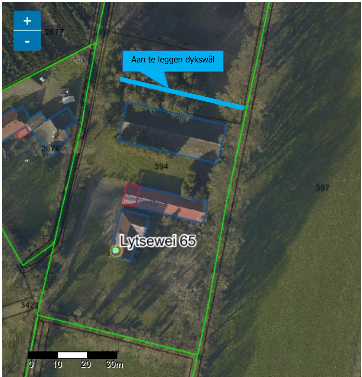
Afbeelding: landschappelijke inpassing Lytsewei 65 Harkema