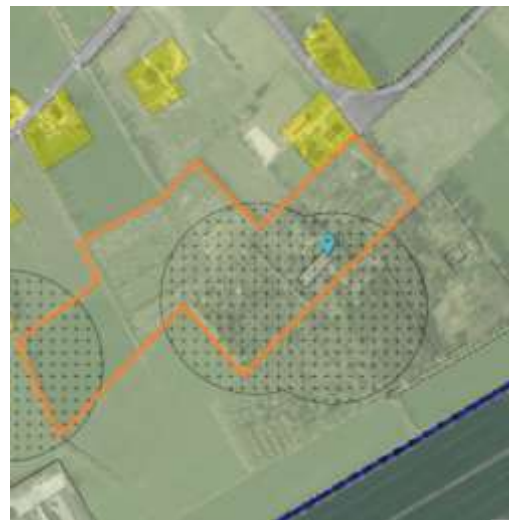
Perceel Wildveld 35 Boelenslaan