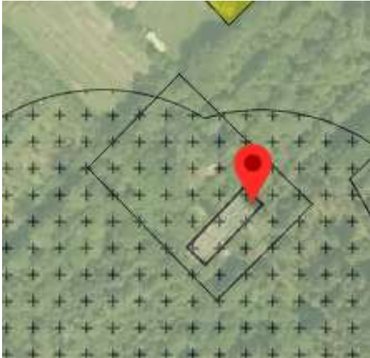
Uitsnede geldend bestemmingsplan perceel wildveld 35 te Boelenslaan

veredelingsbedrijf geldt dat de omliggende bossages en weilanden vallen onder de bestemming agrarisch met waarden -besloten gebied.