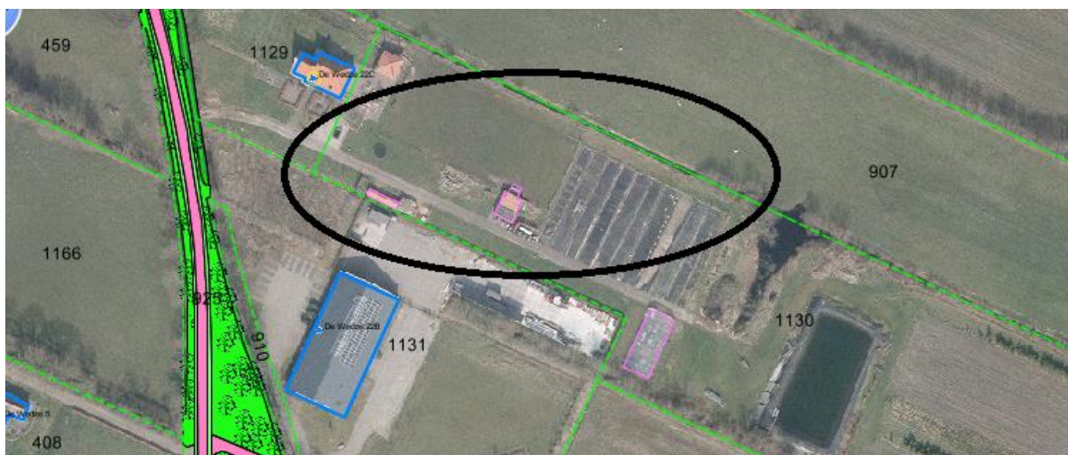
Luchtfoto De Kooten 11 te Kootstertille

Er is op 12 januari 2015 een schriftelijk verzoek binnengekomen om de bestemming van het perceel De Wedze 22c te Twijzel, achter de bestaande woning, te wijzigen ten behoeve van een minicamping. Daarnaast is op 18 januari 2015 een aanvraag omgevingsvergunning voor de activiteit 'handelen in strijd met regels ruimtelijke ordening' door de gemeente ontvangen, die op 3 februari 2015 is aangevuld. Verzoeker wil op het perceel aan De Wedze, achter zijn woning, een minicamping beginnen. Het gaat om een kleinschalige camping voor maximaal 25 plekken. De verzoeker is eigenaar van de betreffende gronden. De gronden zijn kadastraal bekend als Gemeente De Kooten, sectieletter E, perceelnummer 1130.