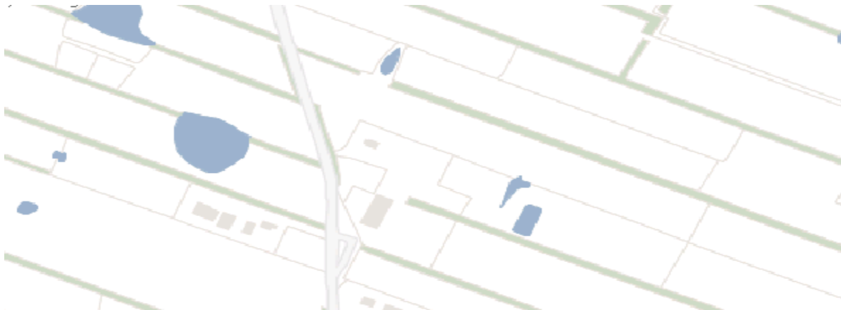
Uitsnede risicokaart provincie Fryslân

Conclusie is dat er vanuit externe veiligheid geen belemmeringen zijn voor de wijziging.