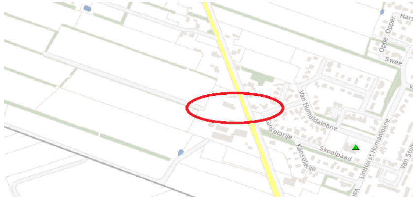
Uitsnede risicokaart provincie Fryslân

Het bouw van de loods heeft voldoende afstand tot risicovolle inrichtingen en voegt ook geen risicobron toe. Hieronder het voor het bouwplan relevante deel van de risicokaart: