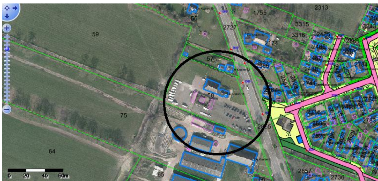
Luchtfoto De Koaten 11 te Kootstertille, oude situatie

Verzoeker wil op het perceel aan De Koaten 11 te Kootstertille starten met een bedrijf in de handel in kraantjes/ trekkers. Momenteel is het bedrijf gevestigd in Hurdegaryp. Het gaat om de stalling van 10-12 kraantjes/ trekkers. Er vindt geen reparatie op het perceel plaats. 95% van de handel vindt plaats via het internet, zo geeft verzoeker aan.