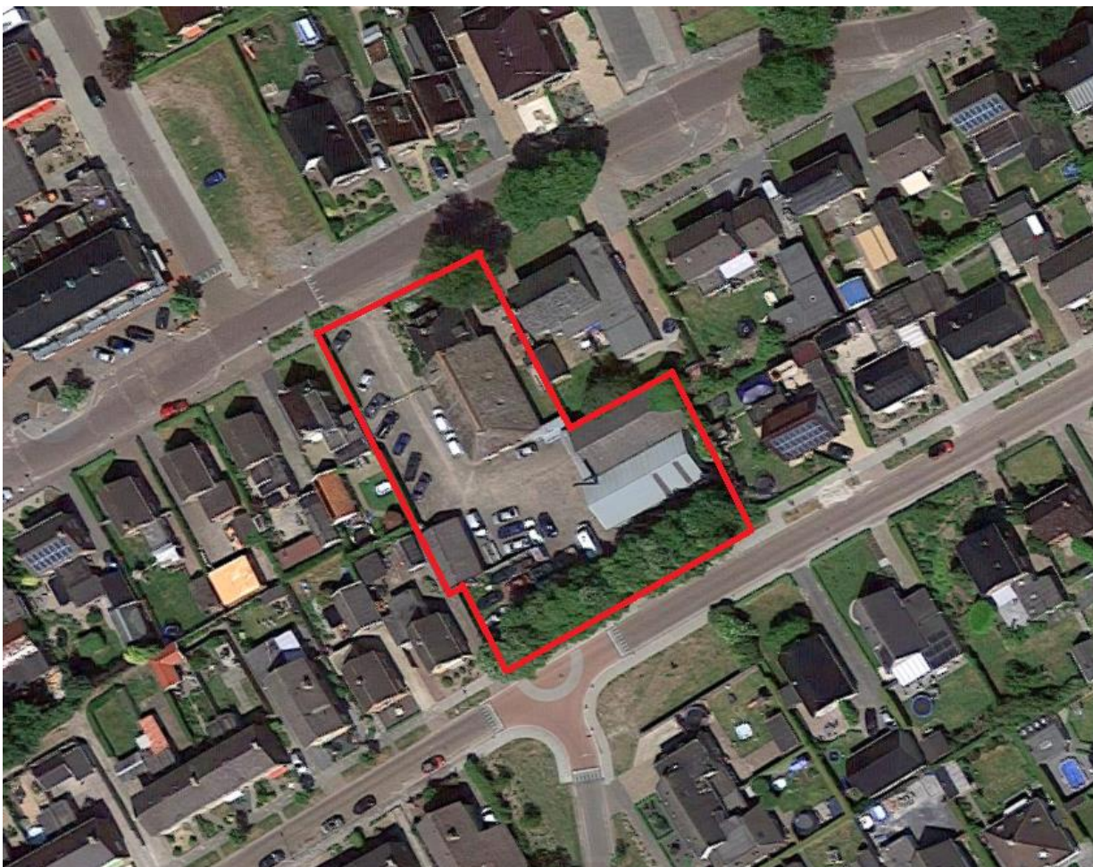
Fig. 1: de ligging van het plangebied

Om de ontwikkeling planologisch-juridisch mogelijk te maken, dient een nieuw bestemmingsplan te worden opgesteld. Onderhavig bestemmingsplan voorziet hierin.