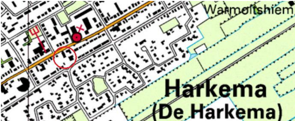
Fig. 8: ligging plangebied op historische kaart in 2005

In bovenstaande figuren is een tijdsreis weergegeven waarin de ontwikkeling van de landschappelijke structuur van Harkema in de loop van de tijd is te zien. De eerste bebouwing, de boerderij, binnen het plangebied is vanaf 1850 te zien.