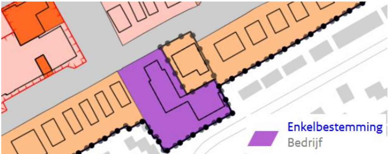
Fig. 3: uitsnede verbeelding vigerend bestemming

verband houden met de bedrijfsuitoefening, bedrijfswoningen, met daaraan ondergeschikt wegen en paden, groenvoorzieningen, water en parkeervoorzieningen met de daarbij behorende tuinen, erven en terreinen, bouwwerken geen gebouwen zijnde. In figuur 3 is een uitsnede van de verbeelding ingevoegd.