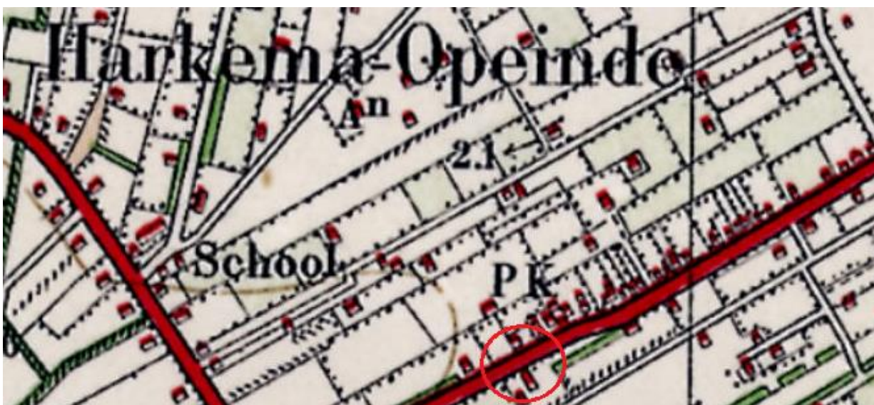
Fig. 6: ligging plangebied op historische kaart in 1930