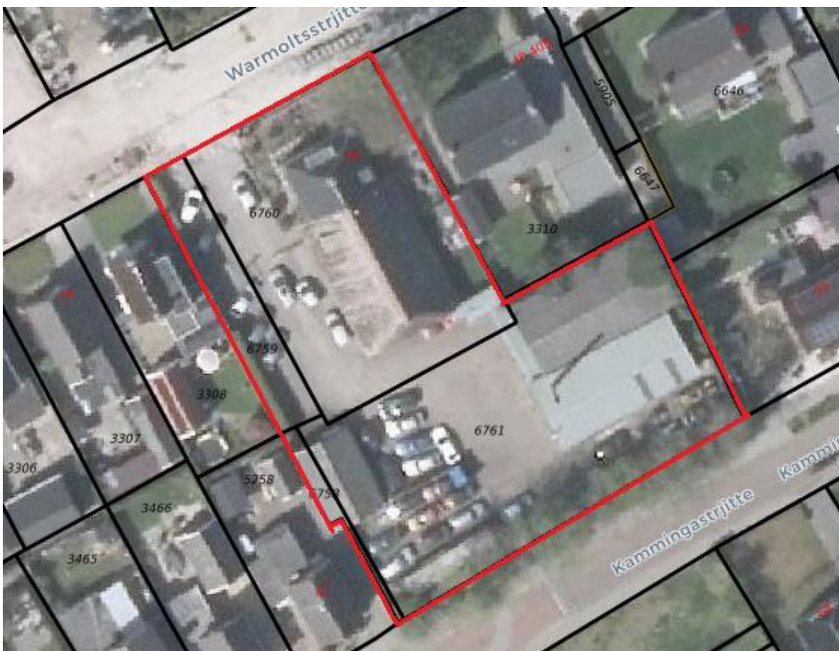
Fig. 2: kadastrale grenzen plangebied

De ligging van het plangebied is globaal weergegeven op bovenstaande luchtfoto (figuur 1). Het betreft de gronden van Warmoltsstrjitte 38, kadastraal bekend als Surhuizum, sectie C, perceelnummers 6758, 6759, 6760 en 6761 (figuur 2).