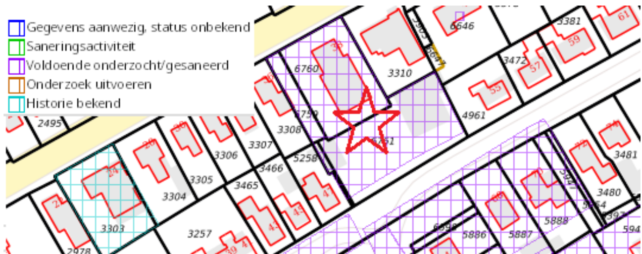
Fig. 13: plangebied weergegeven op de bodemkaart

In figuur 13 is een fragment van het plangebied weergegeven op een uitsnede van het bodemloket. Dit fragment is echter van een (te) oud bodemonderzoek.