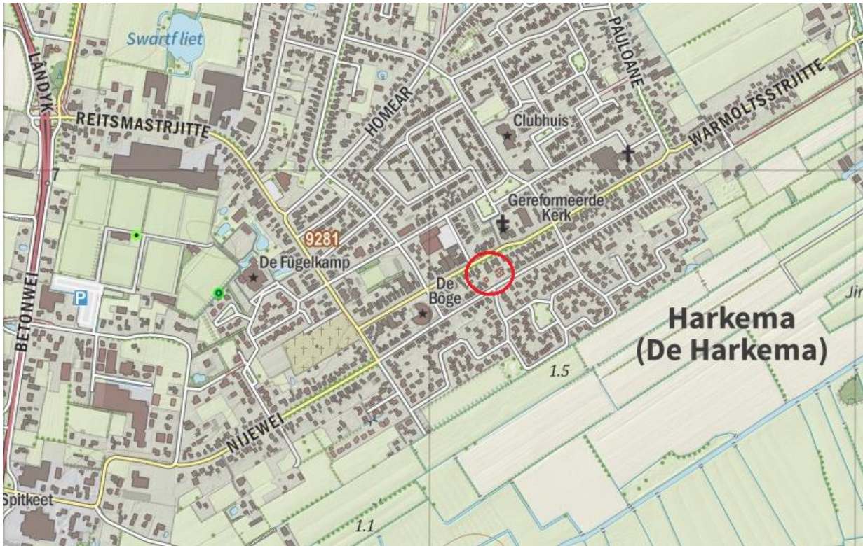
Fig. 4: topografische ligging van het plangebied