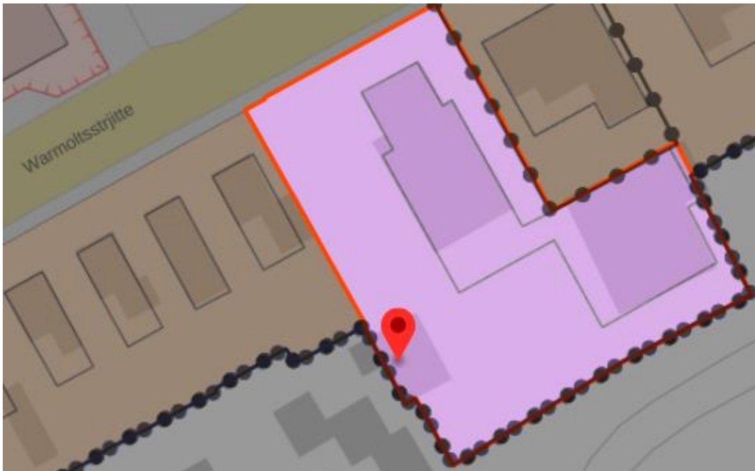
Fig. 8: huidige planologische situatie

Op het perceel Warmoltsstrjitte 38 staat een woonboerderij en een aantal loodsen die door het garagebedrijf werden gebruikt dat op het perceel was gevestigd. De bedrijfsactiviteiten van het garagebedrijf zijn beëindigd en de gebouwen staan leeg. Op het perceel rust de bestemming 'Bedrijf'.