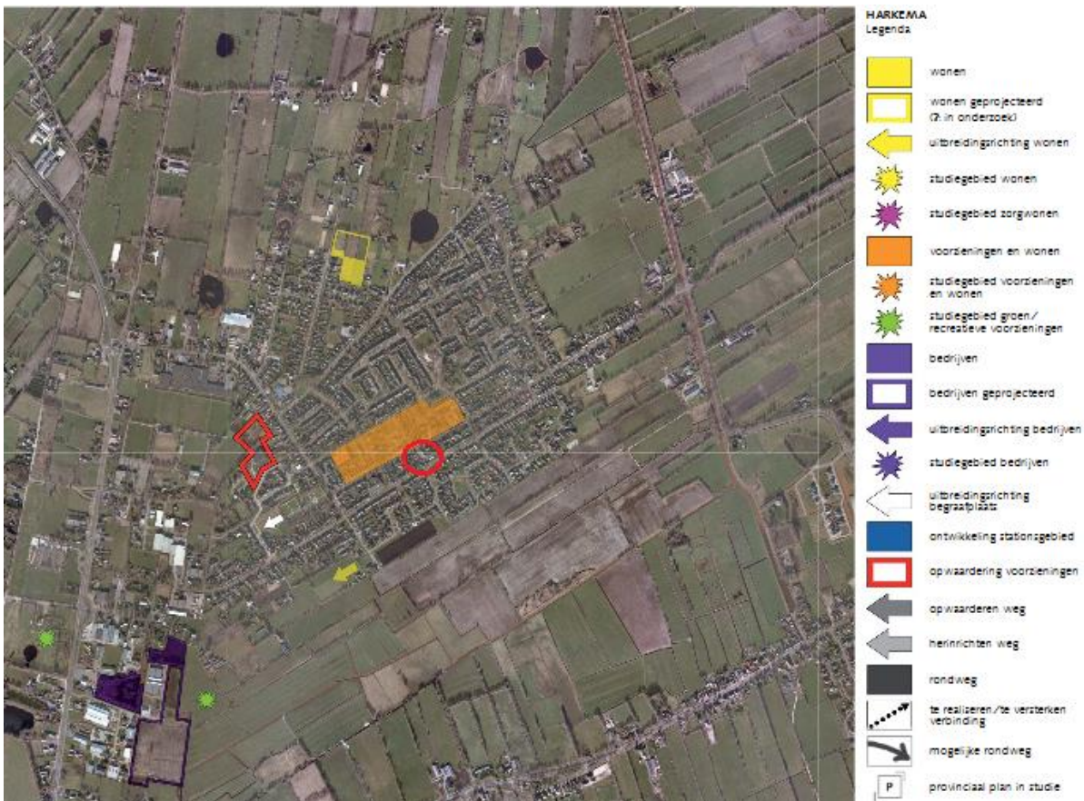
Fig. 11: plangebied op verbeelding van de structuurvisie voor Harkema

Achtkarspelen wil zich verder ontwikkelen als aantrekkelijke woongemeente. Het plan voldoet qua woningtypologie aan deze doelstelling. Het plangebied ligt op de grens van het gebied dat is aangeduid als 'voorzieningen en wonen'.