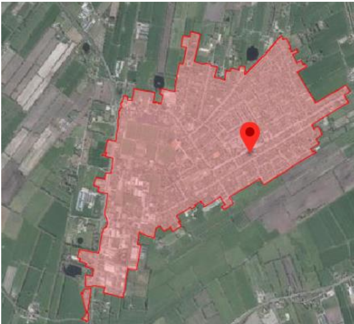
Fig. 10: plangebied aangeduid binnen bestaand stedelijk gebied

De gemeenten in de regio Noordoost Fryslân en de provincie Fryslân hebben regionale woningbouwafspraken met elkaar gemaakt voor de periode 2020 – 2025. Gedeputeerde Staten geven de regio en de gemeenten meer verantwoordelijkheden op de woningmarkt. Conform de uitgangspunten van het coalitieakkoord wordt in de regionale woningbouwafspraken ingezet op een passende, kwalitatief goede en duurzame woningmarkt. Er is daarbij aandacht voor de samenstelling en kwaliteit van de bestaande woningvoorraad en een zorgvuldige toevoeging van nieuwbouw. De afspraken zijn vertaald in een woningbouwprogrammering dat door de provincie moet worden goedgekeurd. Echter de locatie is gelegen binnen bestaand stedelijk gebied en past binnen de afspraken dat de gemeente de regie heeft over de binnenstedelijke woningbouwontwikkeling en draagt bij aan passend, kwalitatief goede en duurzame woningvoorraad. Hiermee past het plan binnen het provinciaal beleid.