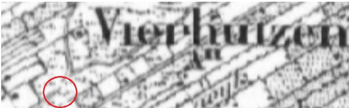
Fig. 5: ligging plangebied op historische kaart in 1850

Het plangebied ligt aan de Warmoltsstrjitte en grenst aan de achterkant aan de Kammingastrjitte. De eerste bebouwing op het perceel was een boerderij.