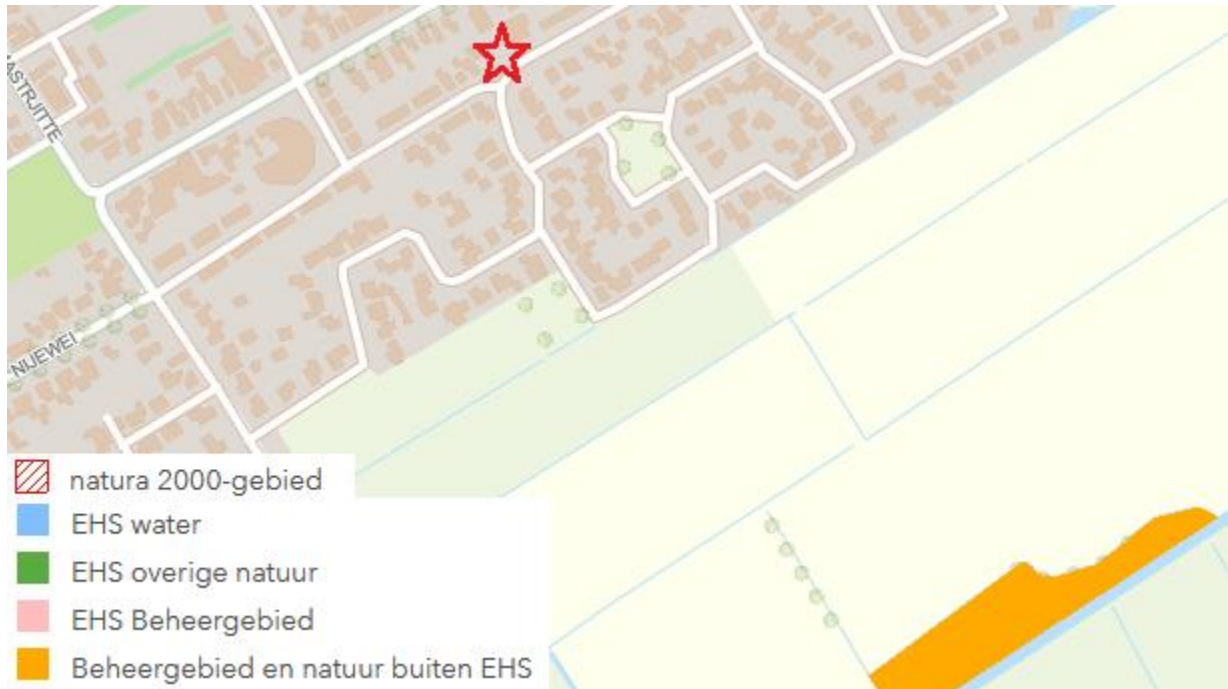
Fig. 12: Ligging plangebied ten opzichte van NNN (vm. EHS) en/of Natura 2000-gebieden

Geconcludeerd wordt dat op grond van de ligging, de afwezigheid van kritische biotopen en het ontbreken van watergangen of -partijen in of het plangebied de aanwezigheid van de volgende soortgroepen op voorhand kan worden uitgesloten: amfibieën, reptielen, insecten (dagvlinders, libellen en kevers) en andere ongewervelden, vissen en zoogdieren anders dan vleermuizen.