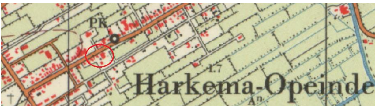
Fig. 7: ligging plangebied op historische kaart in 1965