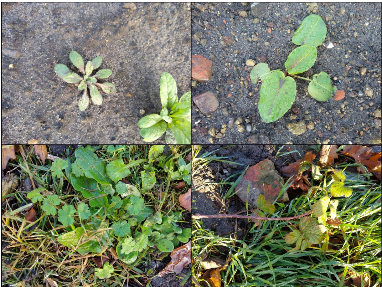
Figuur 2.1. Impressie van de flora in het plangebied met v.l.b.n.r.o.: vroegeling, ridderzuring, ooievaarsbek (spec.), braam (spec.).