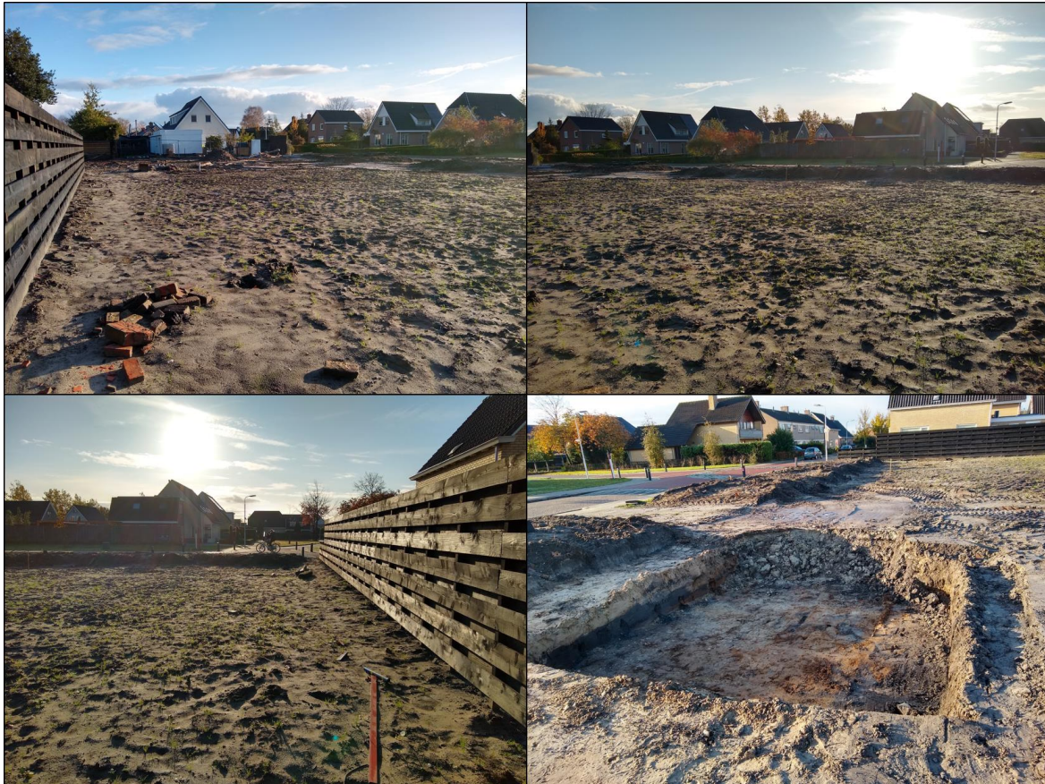
Figuur 1.2. Impressie van het plangebied.

Het planvoornemen bestaat uit het realiseren van drie woningen op het reeds gesaneerde plangebied.