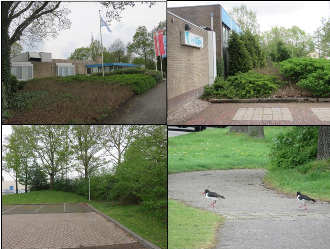
Figuur 2.3. Nestgelegenheid voor merel, zanglijster en winterkoning in de vorm van hagen en struiken binnen en vlak buiten het plangebied, zowel als een koppel scholeksters, die mogelijk op de platte daken broeden.