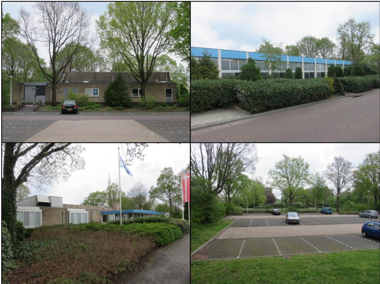
Figuur 1.2. Impressie van het plangebied.

Het planvoornemen bestaat uit het slopen van het zwembad en het realiseren van een nieuw zwembad op de huidige parkeerplaats. Ter plaatse van het huidige zwembad wordt een nieuwe parkeerplaats gerealiseerd.