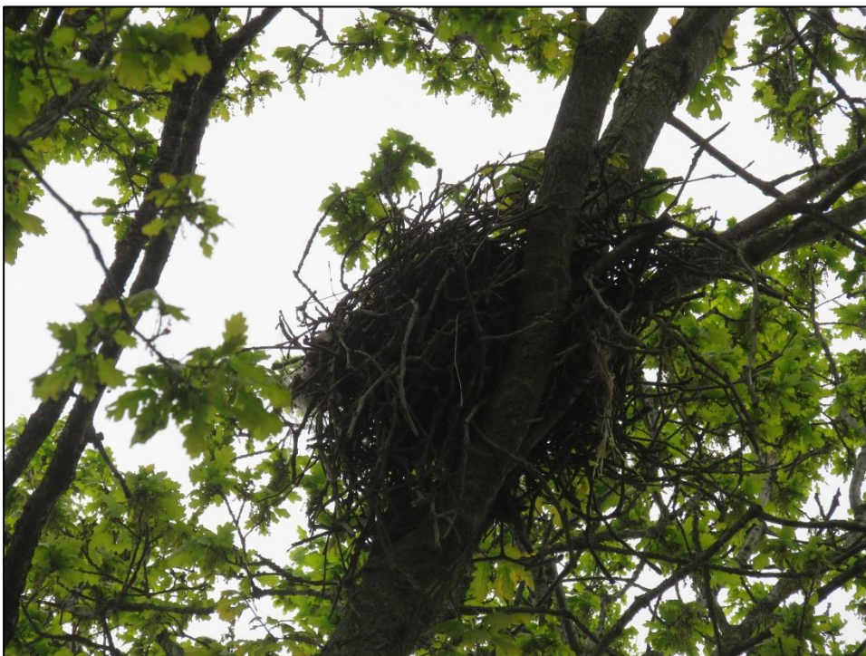
Figuur 2.2. een nest van de soort zwarte kraai.

Echter, voor de soort gierzwaluw zijn er wel enkele geschikte in- en uitvlieg openingen aangetroffen welke als doorgangen tot verblijfplaatsen kunnen functioneren. Dit correspondeert met meerdere waarnemingen van de soort binnen het plangebied (bron: NDFP). Het voorkomen van gierzwaluw kan niet op voorhand worden uitgesloten.