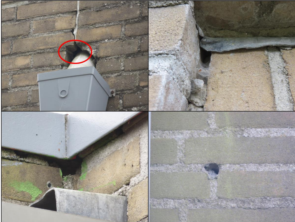
Figuur 2.3. Kieren en gaten rondom het zwembad die mogelijk toegangen tot verblijfplaatsen van vleermuizen vormen.

Naast verblijfplaatsen van vleermuizen, kunnen ook vliegrouetes en/of foerageergebieden van vleermuizen een beschermde status hebben als deze van essentieel belang zijn voor het in stand houden van een verblijfplaats. Als vliegrouete worden afhankelijk van de soort waterlichamen, bosranden, bomenlanen of gebouwen gebruikt. Mogelijk wordt bij het slopen van het bestaande zwembad een vliegrouete doorbroken. Echter, doordat de omgeving voldoende alternatieven biedt, kunnen negatieve effecten op essentiële vliegrouetes en/of foerageergebieden op voorhand worden uitgesloten.