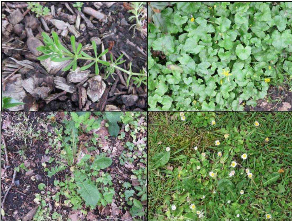
Figuur 2.1. Impressie van de flora in het plangebied met v.l.b.n.r.o.: kleefkruid, speenkruid, paardenbloem en madeliefje.