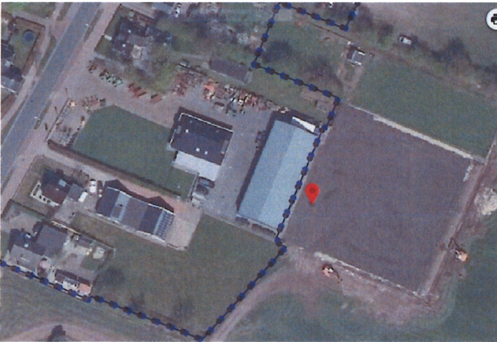
Luchtfoto Optwizel 91 en omgeving

De initiatiefnemer geeft aan dat verplaatsing van het gehele bedrijf naar bijv. het bedrijventerrein van Buitenpost geen optie is, omdat de het bedrijf op de huidige locatie centraal in zijn werkgebied gevestigd is. De aanrijtijden zijn daardoor beperkt. Voorts is Buitenpost of andere locatie geen optie vanwege de forse investeringen die op de huidige bedrijfslocatie zijn gedaan. Een verhuizing zou dan kapitaalvernietiging betekenen.