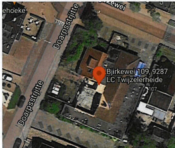
Perceel Bjirkewei 109