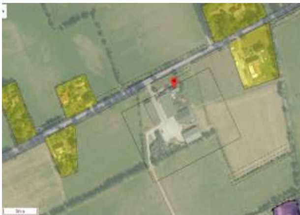
Luchtfofo Parksterreed 5a en omgeving

Er is op 11 december 2020 een aanvraag omgevingsvergunning bij de gemeente binnengekomen voor de bouw van een tweede agrarische bedrijfswoning aan de Parksterreed 5a te Boelenslaan. Het betreft een 2 de bedrijfswoning bij een bestaand biologisch melkveebedrijf met va. 75 melkkoeien. De zoon van de aanvrager, die ook in de maatschap zit, heeft de leeftijd dat hij graag op zichzelf wil wonen. Gelet op de bedrijfsvoering hebben de initiatiefnemers aangegeven dat er een behoefte en een noodzaak is voor de 2 de agrarische bedrijfswoning. Graag zouden de initiatiefnemers de tweede bedrijfswoning op het bestaande erf bouwen aan de Parksterreed 5a te Boelenslaan.