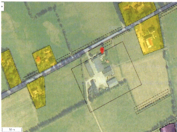
Luchtfofo Parksterreed 5a e.o. met bouwvlak

De raad dient voor het plan een (ontwerp)verklaring van geen bedenkingen af te geven, voordat de omgevingsvergunning door het college kan worden verleend.