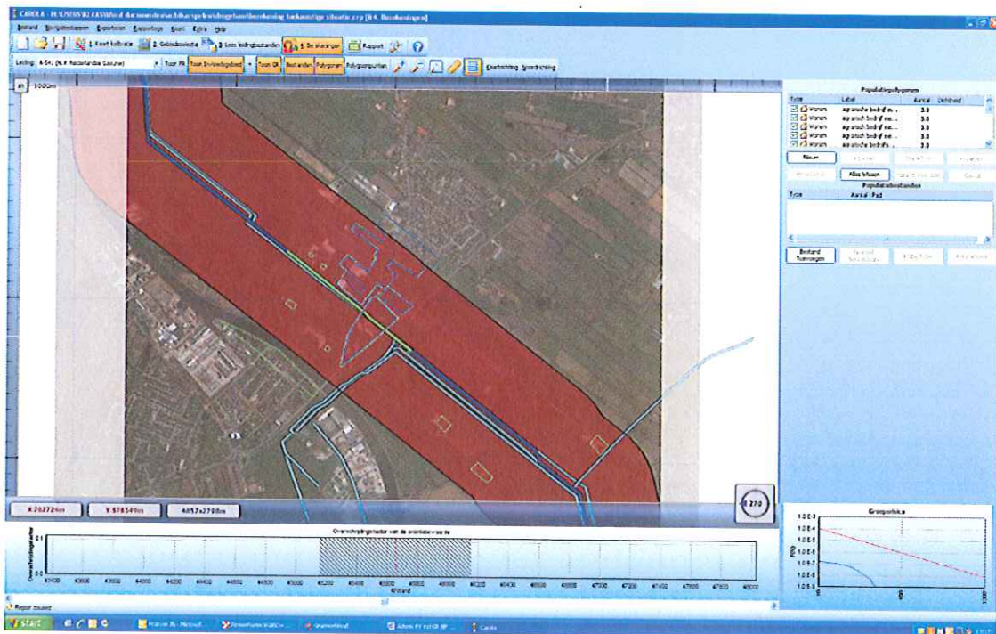
Figuur 2: Toekomstige situatie leiding A541

Uit de FN-curve, zie figuur 2, kan worden opgemaakt dat het GR in de toekomstige situatie niet waarneembaar toeneemt. De maximale overschrijdingsfactor van deze kilometer wordt gevonden bij 22 slachtoffers en een frequentie van 6.66 \times 10^{-8}