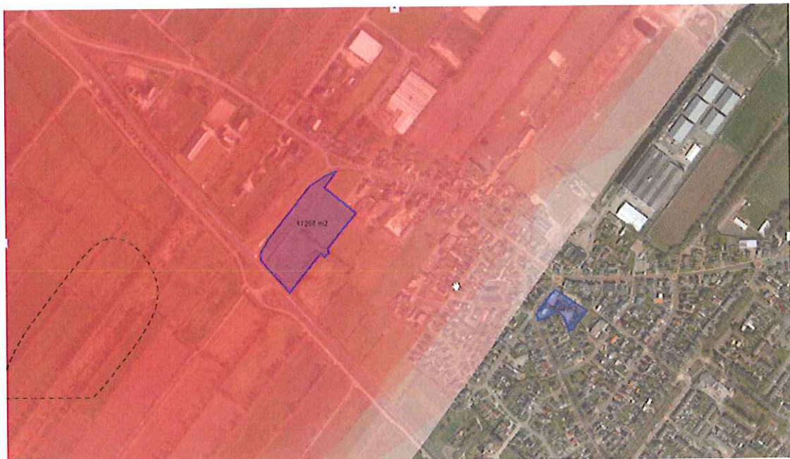
Figuur 1: begrenzing bestemmingsplan Drogeham en risicobronnen

Uit de professionele Risicokaart blijkt dat binnen en in de directe nabijheid van het bestemmingsplan risicobronnen gelegen zijn waarvan de risicocontouren of de invloedsgebieden zijn gelegen binnen één van de percelen, namelijk perceel Tillewei (zie figuur 1).