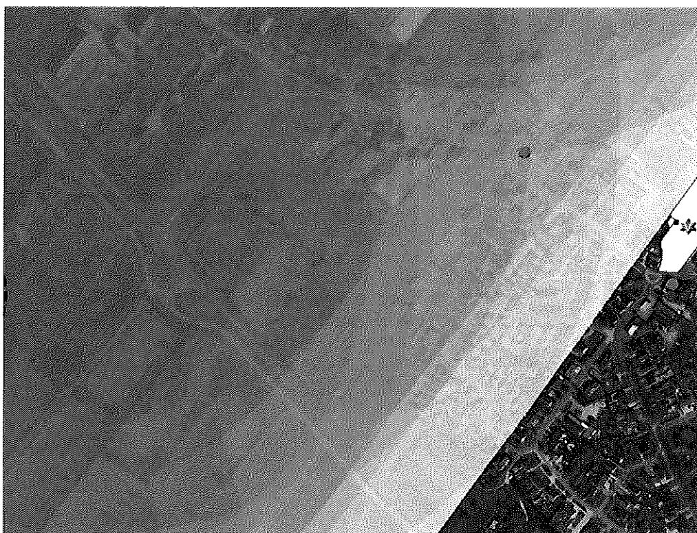
Uitsnede 30-11-2011 uit de risicokaart betreffende risicovolle activiteiten in het plangebied

Hieronder is de uitsnede van de professionele risicokaart opgenomen.