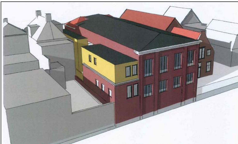
Figuur 10. Impressie van de achter- noordgevel