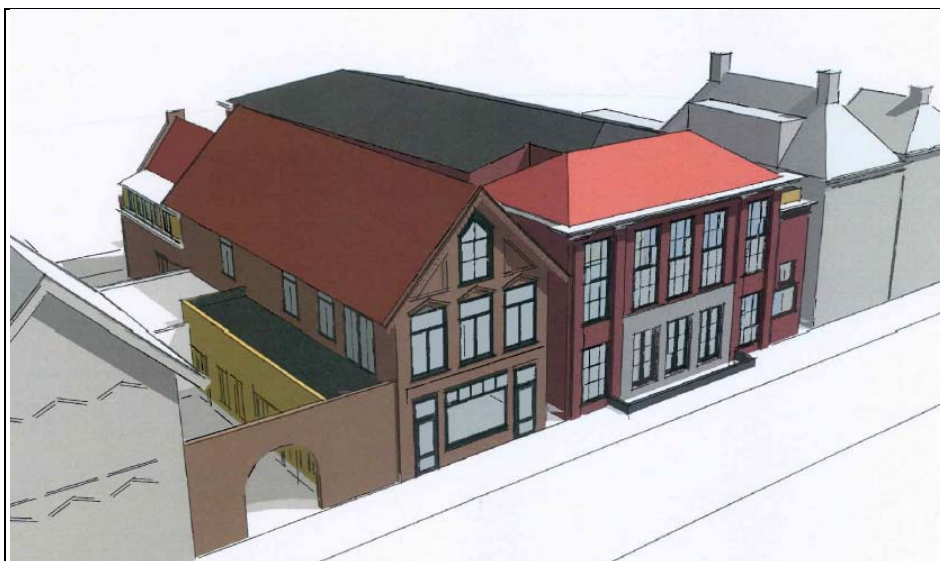
Figuur 8. Impressie van de voor- en zijgevel