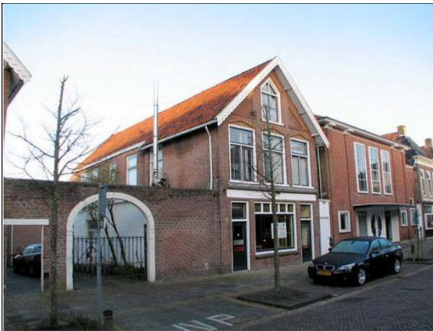
Figuur 3. Bestaande voorgevel