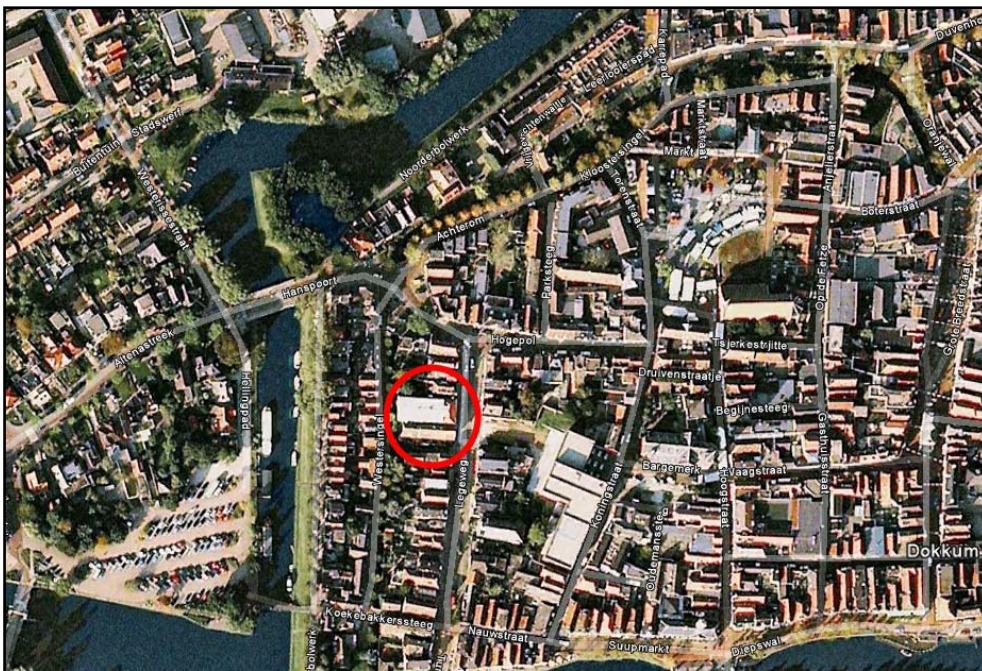
Figuur 1. De ligging van het plangebied

In dit wijzigingsplan wordt de gewenste ontwikkeling getoetst aan de voorwaarden van de wijzigingsbevoegdheid.