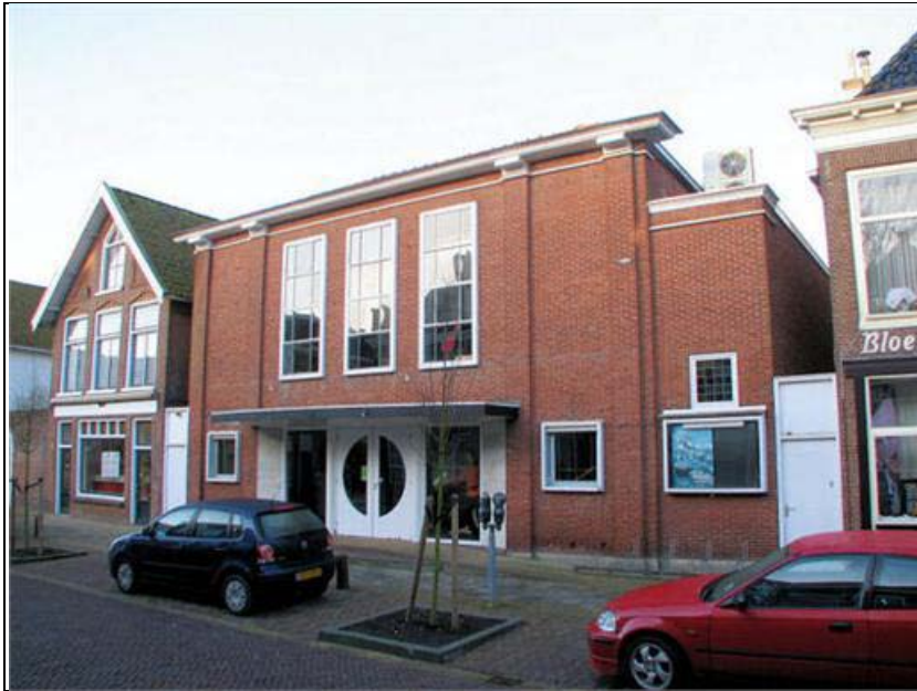
Figuur 2. Bestaande voorgevel