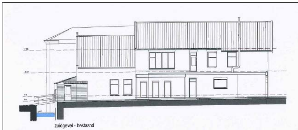
Figuur 5. Bestaande zuidgevel