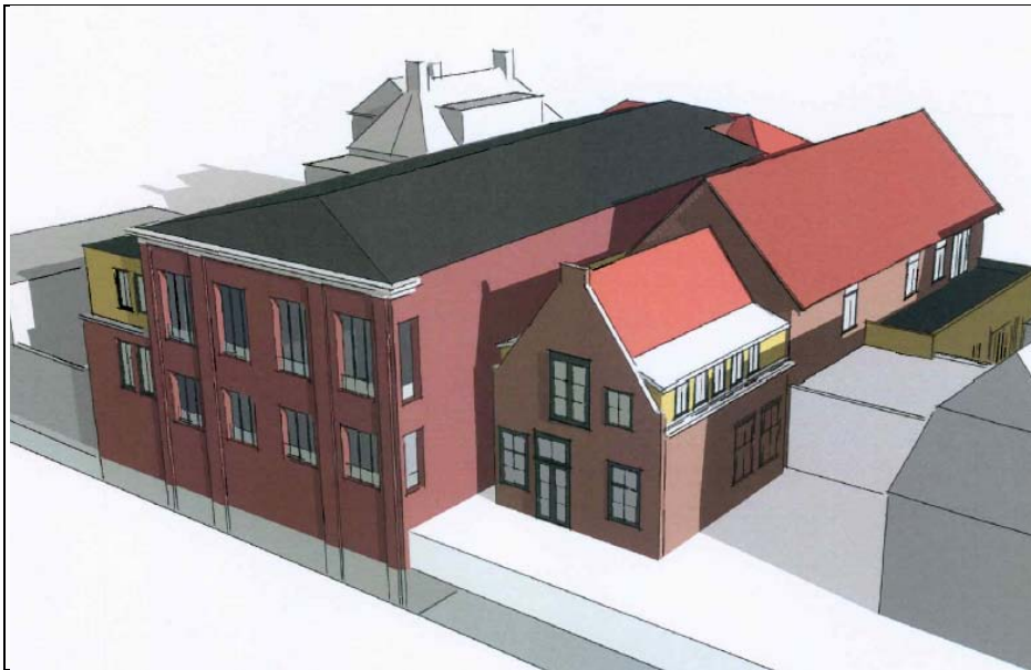
Figuur 9. Impressie van de achter- en zuidgevel