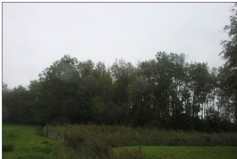
Figuur 1.3 Bosperceel vanuit het westen.

Bomeninventarisatie te kappen bosperceel nabij Anjum ten behoeve van compensatiebepaling aanleg parkeerterrein projectnummer 405833 17 september 2015 revisie 0A Nederlandse Aardolie Maatschappij B.V.