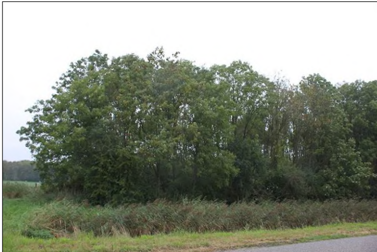
Figuur 1.1 Bosperceel vanuit het zuiden.