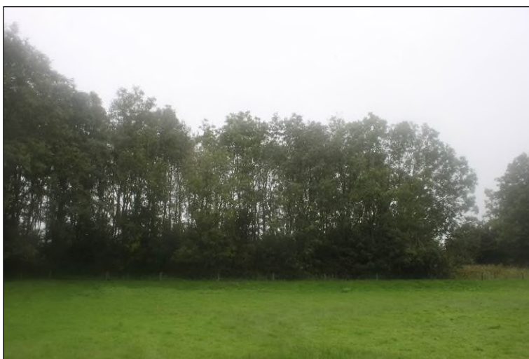
Figuur 1.2 Bosperceel vanuit het noorden.