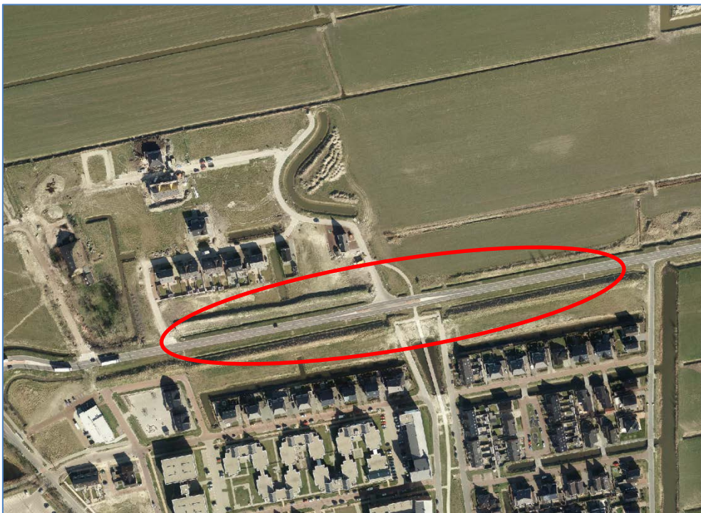
Figuur 1. Ligging plangebied Oostergast (2014) met plangebied wijzigingsplan (indicatief)