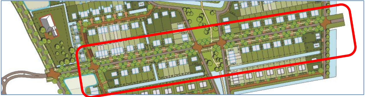
Figuur 3. Situatie nieuwbouw

De hoofdvorm zal bestaan uit woningen van maximaal twee bouwlagen met een (geheel of gedeeltelijke) kapafdekking.