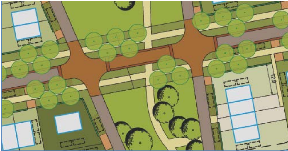
Figuur 4. Nieuwe profielindeling Het Noorderlicht: principeprofiel ter hoogte van dorpsweide

Ten slotte wordt opgemerkt, dat - waar de wijzigingsplannen een globale opzet kennen en alleen de hoofdvorm van de woningen regelen - over de kwalitatieve invulling (zaken van beeldkwaliteit) nadere afspraken met de ontwikkelende partij worden gemaakt in de vorm van een beeldkwaliteitsplan. Dit vindt plaats op basis van het gemeentelijke welstandsbeleid.