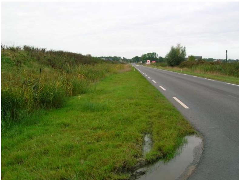
Foto 1 Impressie van het plangebied.

De zone langs de oude provinciale weg (gebied 1 en 2) is een onbebouwd terrein met een breedte van ongeveer 50 meter, waarin een laagblijvende vegetatie aanwezig is. De zone bestaat uit een (niet permanent waterhoudende) greppel, een ruig begroeide grondwal en een strook grasland. Daarachter wordt het plangebied aan de zuidzijde op de meeste plaatsen begrensd door een brede sloot. Deze sloot valt zelf buiten de begrenzing van het plangebied. De aanwezigheid van water in het plangebied is beperkt tot enkele dwarsslotjes. Deze dwarsslotjes behouden hun functie en vallen buiten de begrenzing van het plangebied. Bomen en struiken zijn niet aanwezig. Wro-wijzigingsgebied 3 is een gebied dat grotendeels is verhard.