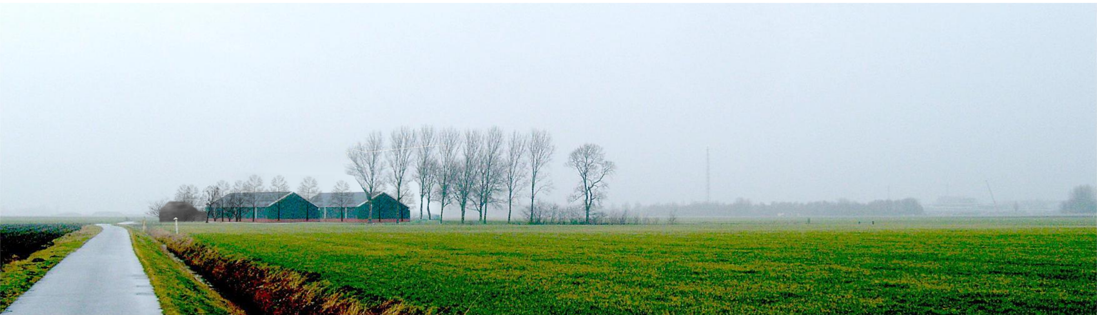
impressie erf na 10 jaar