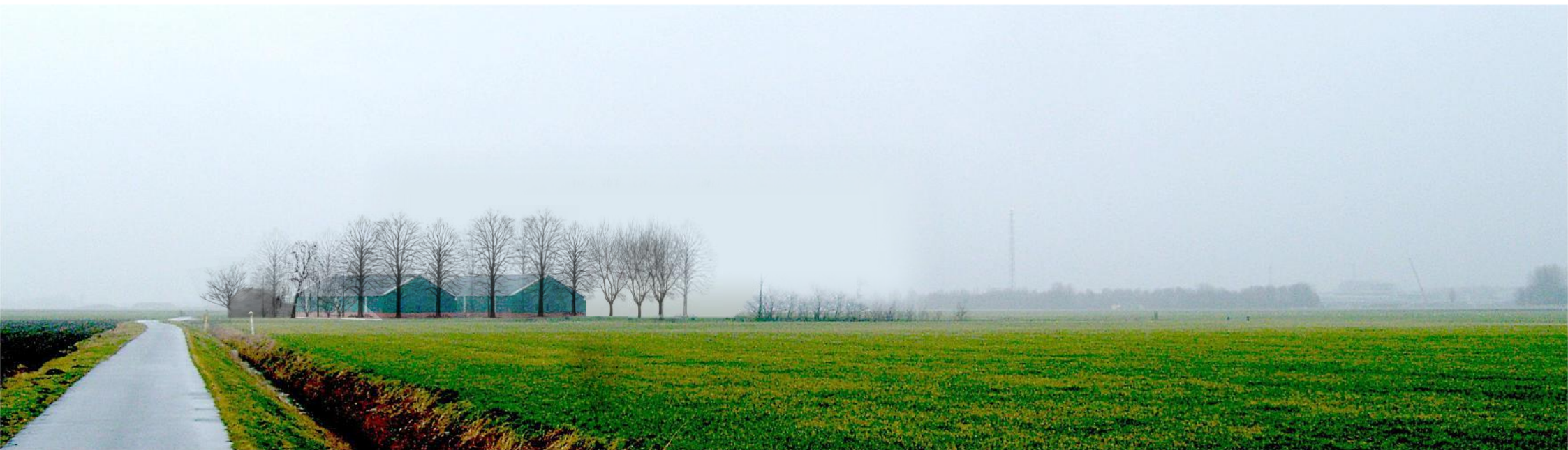
impressie erf na 20 jaar