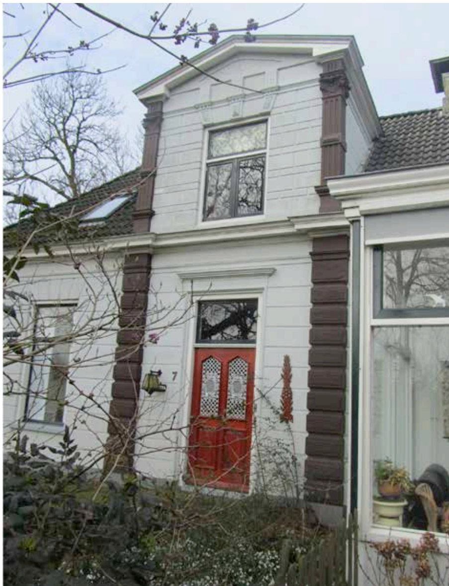
foto zuidgevel voorhuis

Het historische erf en de bebouwing dragen in sterke mate bij aan het agrarische landschapsbeeld. Het ensemble is een kenmerkend voorbeeld van historische boerderijbebouwing in de gemeente. De architectuurhistorische waarde is hoog onder meer vanwege het onderscheid tussen het sober functionele bedrijfsgedeelte en het veel rijker uitgewerkte, representatieve voorhuis in eclectische stijl. Het historische bebouwingsbeeld is relatief gaaf bewaard gebleven. Uit bovenstaande blijkt dat zowel de cultuurhistorische waarde als de ruimtelijke relevantie van de boerderij aanzienlijk zijn.