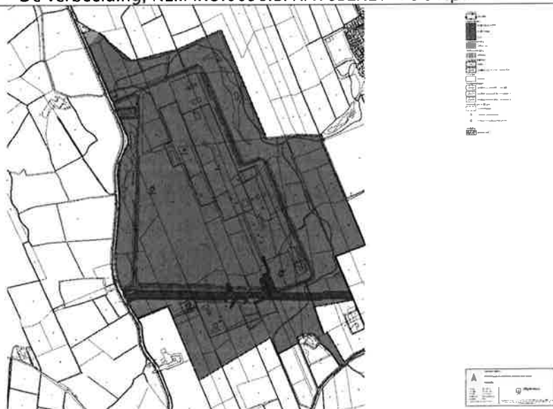
Figuur 1: verbeelding bestemmingsplan Bedrijventerrein Energie en Gas Grijpskerk