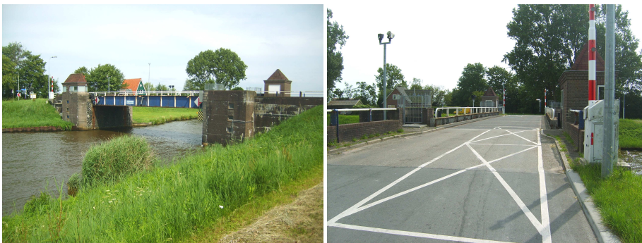
Locatie 2: te vervangen brug 'Dorkwerd'