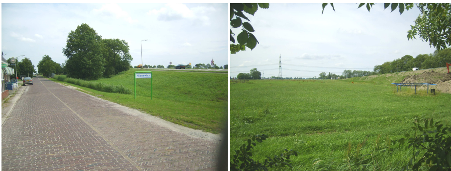
Locatie 5: beoogde locatie pookaansluiting N355