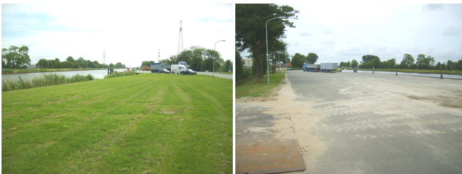
Locatie 3: locatie nieuwe brug t.h.v. de loswal Aduard

Ten oosten van Aduard zal parallel aan de Albert Harkemaweg een rondweg komen. In de noordoostelijk hoek zal de rondweg dwars door het slibdepot komen te liggen. Deze is begroeid met loofbos en is in eigendom van de provincie Groningen. Aan de westzijde van de Albert Harkemaweg is een houtsingel aanwezig, met veel verouderde Knotwilgen. Daarbij ligt naast deze weg een watergang, welke mogelijk zal worden verlegd. De rondweg zal een deel van de landbouwgronden aan de westzijde van de bestaande weg beslaan. De Albert Harkemaweg zal op de huidige locatie worden omgevormd tot een fietspad.