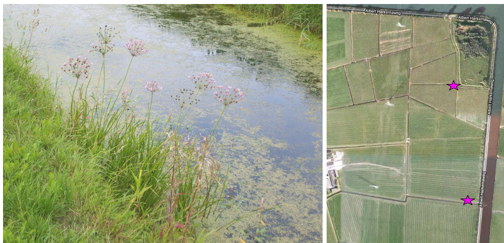
Figuur 3: Zwanebloem op aangetroffen locaties (noordoosthoek plangebied)

slibdepot zijn enkele exemplaren van de licht beschermde Zwanebloem aangetroffen. Deze soort groeit ook in de watergang bij het gemaal halverwege de Albert Harkemaweg (zie figuur 3).