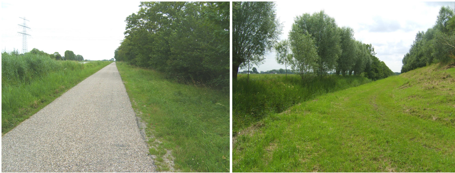
Locatie 4: Albert Harkemaweg, locatie voor rondweg

Ter hoogte van Nieuwklap zal een pookaansluiting deze rondweg met de N355 (Friesestraatweg) verbinden. De bestaande brug over het Auarderdiep zal worden vervangen door een nieuwe brug die iets zuidelijker ten opzichte van de huidige brug zal komen te liggen. Er zal verlichting wordt geplaatst op kruisingen en oversteekpunten.