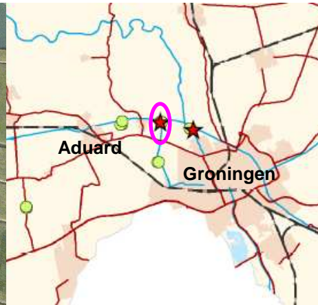
Figuur 6: Uitsnede kaart onderzoek naar Poelkikker. Het plangebied valt binnen de roze cirkel waar in 2008 zowel waarnemingen (groene cirkel) van Poelkikker als voortplantingslocaties (rode asterisk) zijn vastgesteld.