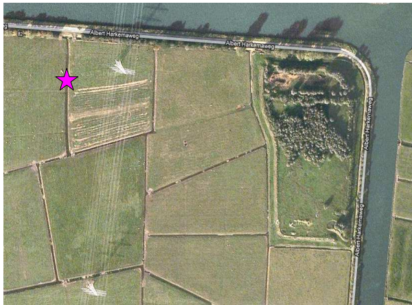
Figuur 5: Noordoosthoek plangebied (rechtsboven het slibdepot) met locatie van gevangen Poelkikker (roze asterisk).