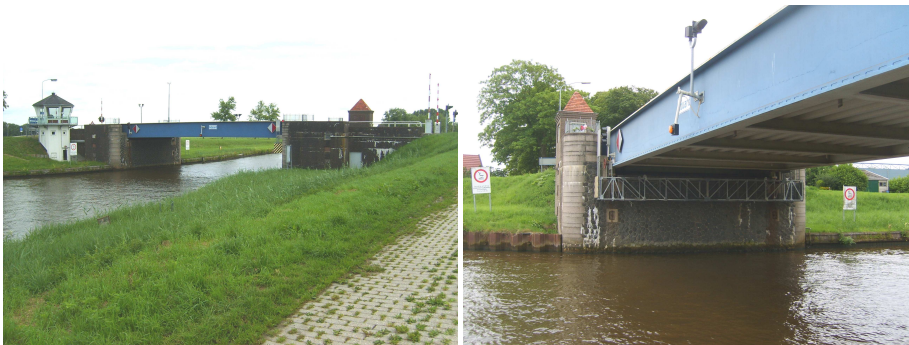
Locatie 1: Brug 'Aduard'

Voor dit onderzoek zijn een aantal locaties bezocht, waaronder de bestaande verouderde bruggen 'Aduard' en 'Dorkwerd' en de locatie voor de beoogde nieuwe brug. De oevers van het kanaal zijn van stalen damwand of hebben een houten beschoeïing. Bij de bestaande bruggen is er aan de zuidwestzijde een brede rietkraag aanwezig. De brug 'Aduard' zal in het geheel worden verwijderd. Er zal een nieuwe brug ter hoogte van de geasfalteerde loswal bij Aduard over het Van Starckenborghkanaal komen.