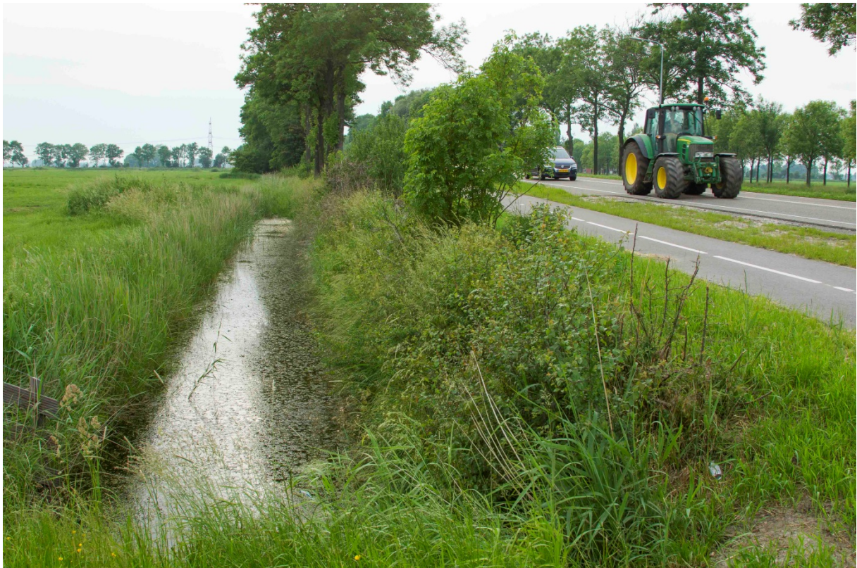
Foto 5. Sloot 3, verborgen achter struikgewas. Hier zijn zeer waarschijnlijk poelkikkers aanwezig.