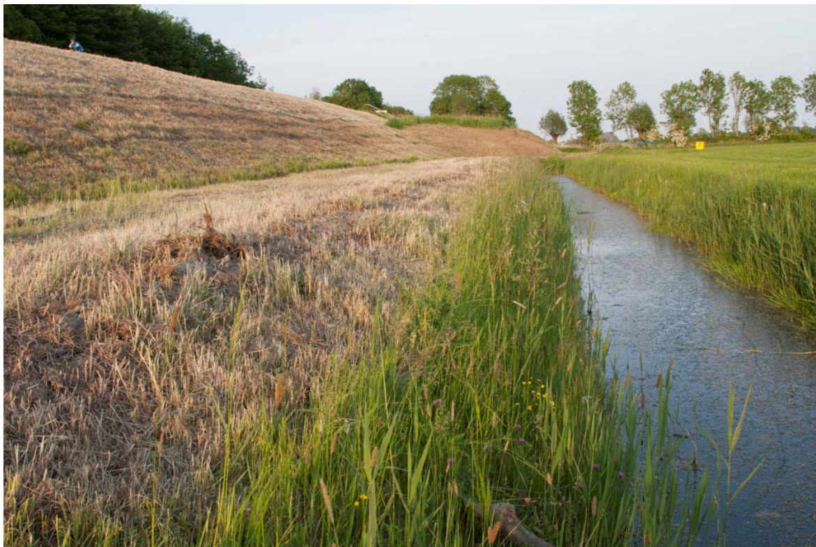
Foto 3. De sloot waar met zekerheid poelkickers zijn aangetroffen (sloot 1, zie figuur1). De grasberm en het talud van het viaduct zijn gemaaid, hetgeen (zeer) ongunstig is voor de poelkikker.

3. Dempen van wateren en ongeschikt maken van land- winterhabitat vindt plaats onder deskundige begeleiding van een ecooloog. Eventueel nog aanwezige / aangetroffen dieren worden direct overgeplaatst naar het nieuwe zomerhabitat (punt 1)