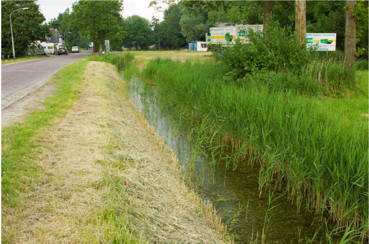
Foto 4. Sloot 2 tegenover het café in Nieuwklap. Hier zijn (waarschijnlijk) enkele sub-adulten aangetroffen.