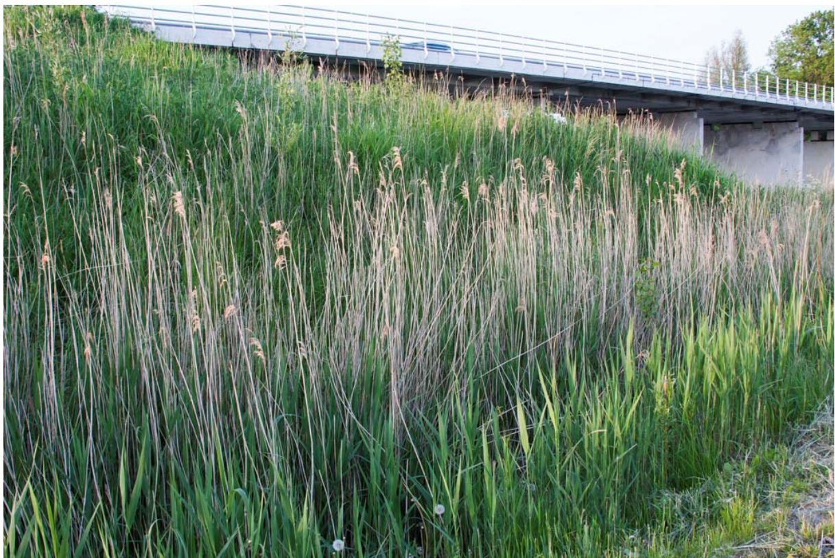
Foto 1. Viaduct bij Nieuwklap met ruige begroeiing.

Uit inventarisatie moet blijken of de poelkikker ook daadwerkelijk voorkomt in de omgeving van (het viaduct van) Nieuwklap.