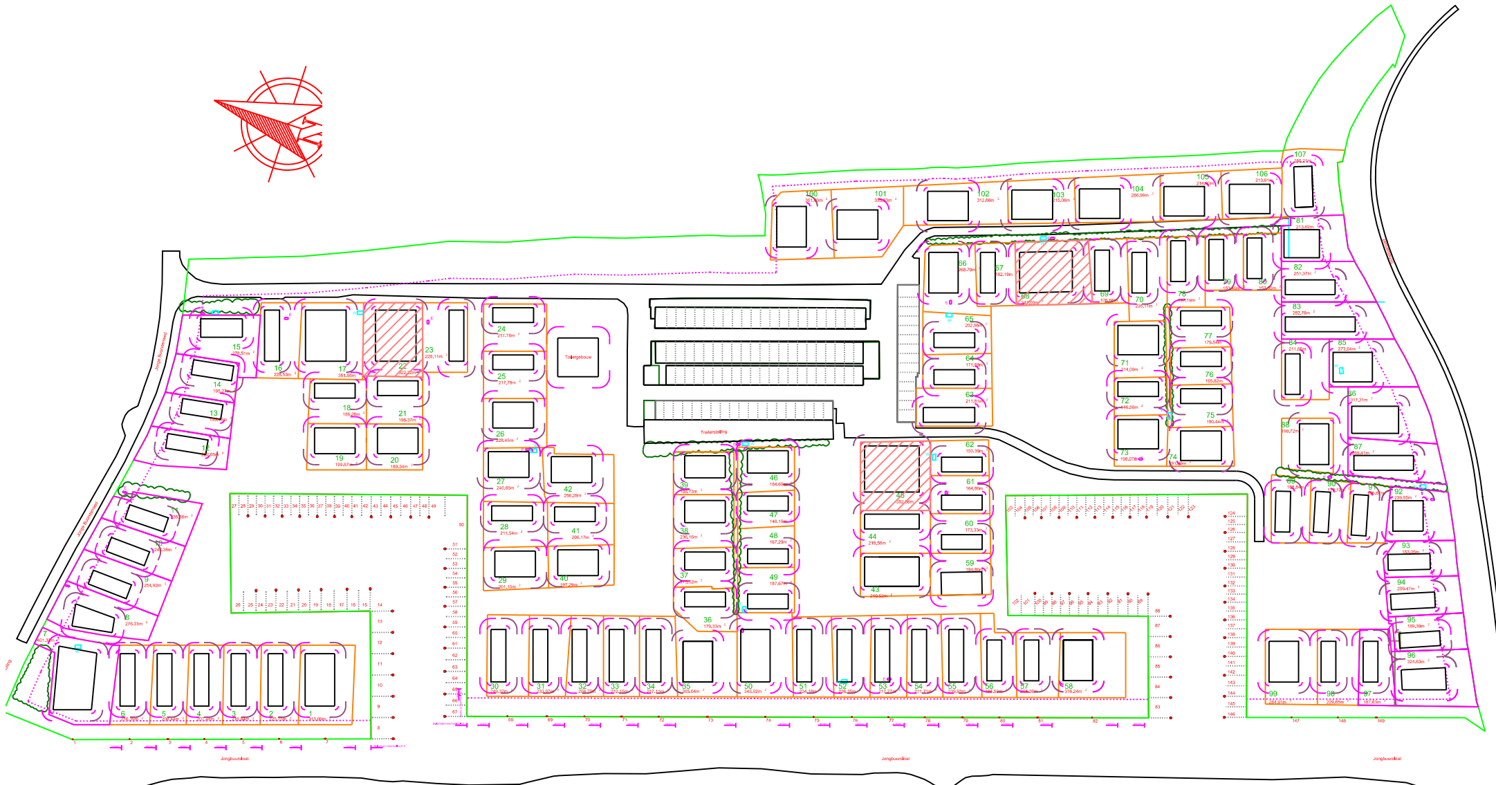
Bijlage 1. Verkavelingsplan De Zoutpoel