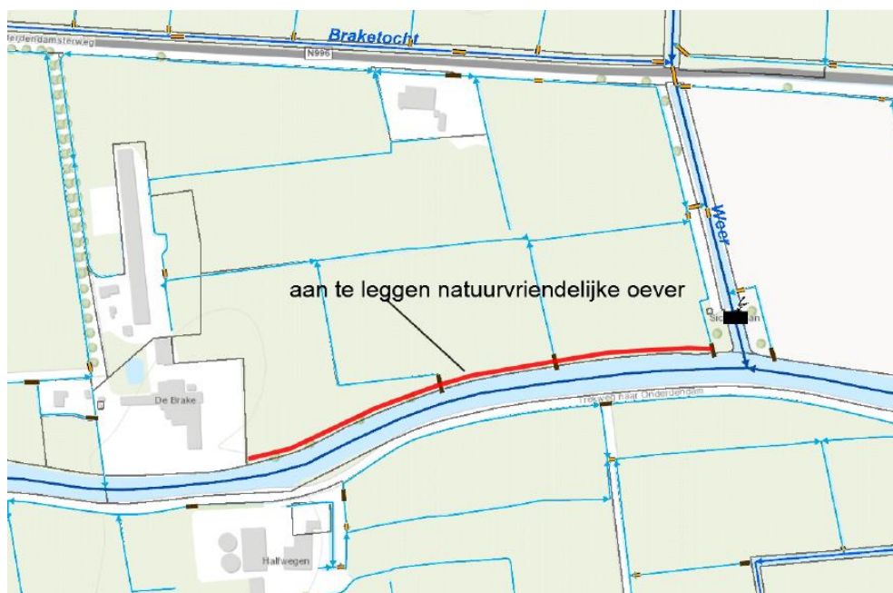
Figuur 1: Ligging projectgebied

Het projectgebied is gelegen ten oosten van het dorp Winsum. Het projectgebied betreft de oevers langs de noordkant van het Winsumerdiep, begrensd door het perceel Onderendamsterweg 50 aan de westkant en de dwarsloot de Weer aan de oostkant.