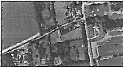
Luchtfoto van het plangebied

De aanleiding voor het opstellen van een bestemmingsplan voor de locatie aan de Kruisweg/Oosterweg is het voornemen van de heer F. Zwerver om op deze locatie in totaal twee woningen te bouwen.