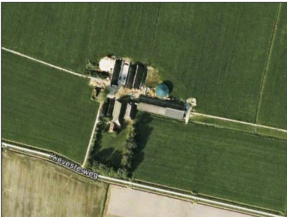
Figuur 2. Huidige situatie

Het erf is gelegen in het wierdenlandschap van Noord Groningen. Het landschap wordt gekenmerkt door kronkelende waterloopjes (maren), een blokvormige onregelmatige verkaveling, bosjes en wierden. Kenmerkend zijn ook de oude, ruim opgezette erven met bossingels, boomgaarden en grachten. Het erf 'De Kiest' betreft een ouder erf, waar aan de voorzijde een grote boomgaard en een gracht zijn te herkennen.