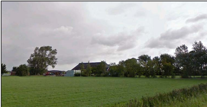
Figuur 3. Zicht vanaf de Kievesterweg