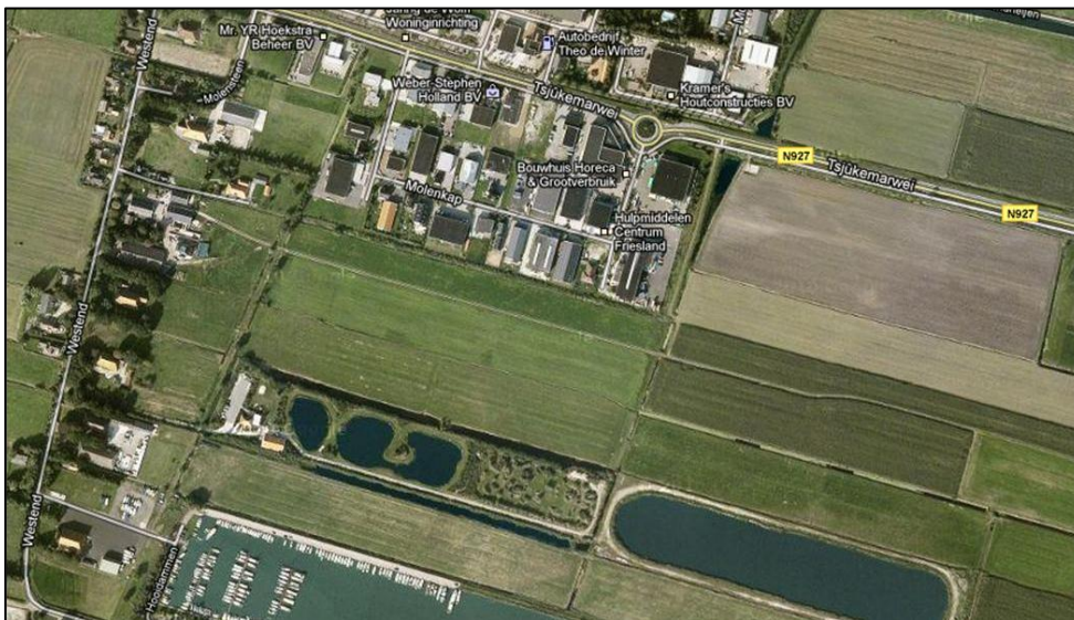
Figuur 2. Luchtfoto huidige situatie

De bedrijventerreinen van Sint Nicolaasga bevinden zich ten zuidoosten van het centrum. Op deze terreinen is de bedrijvigheid geconcentreerd. De bedrijventerreinen Het Slot I en II zijn vanaf de jaren zeventig ontwikkeld en in de jaren tachtig uitgebreid. Vanaf het eind van de jaren negentig is het nieuwste bedrijventerrein Slotmolen ten zuiden van de Tsjûkemarwei ontwikkeld. De Tsjûkemarwei is de belangrijkste ontsluiting van Sint Nicolaasga met de A6. De onderstaande luchtfoto toont de huidige situatie in en rondom het plangebied.