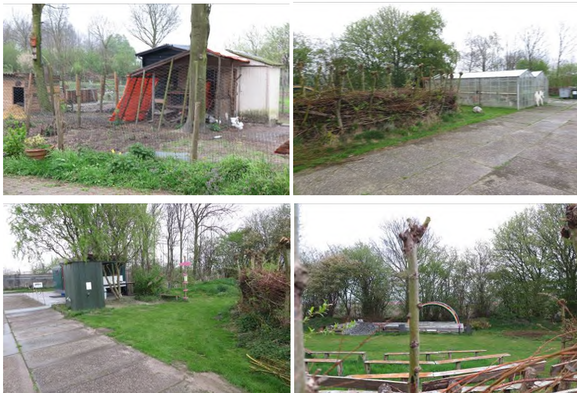
Vervolg figuur 3. Foto-impressie van het plangebied aan de Sternweg 14 te Zeewolde (tuin).