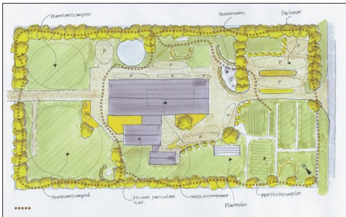
Figuur 4. Plansituatie Sternweg 14 te Zeewolde.

Het plan omvat de sloop van schuren en de realisatie van nieuwbouw waarin het bieden van 24 uren zorg en hotelaccommodatie mogelijk zijn. De tuin rondom blijft grotendeels behouden. In figuur 4 wordt een beeld gegeven van de plansituatie.