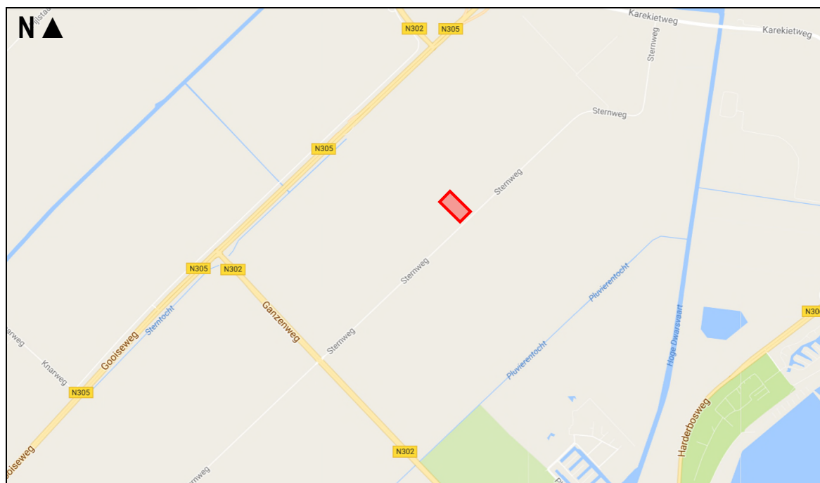
Figuur 1. Globale ligging van het plangebied Sternweg 14 te Zeewolde.

Het plangebied is gelegen aan de Sternweg 14 te Zeewolde en bestaat uit schuren met verhardingen en rondom een tuin (zie figuur 1 voor de globale ligging en bijlage 1 voor de exacte ligging en begrenzing). De schuren hebben een recreatieve bestemming (Sternhof). In figuur 2 wordt een beeld gegeven van het plangebied op donderdag 12 april 2017.