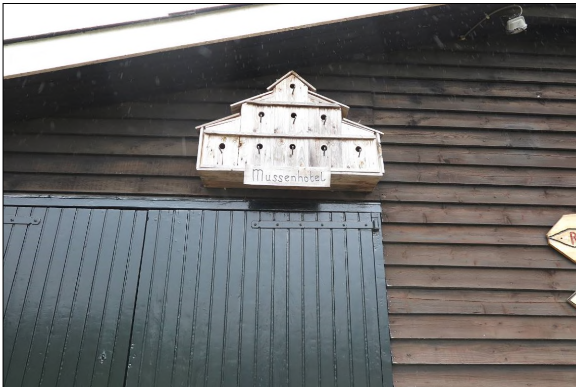
Figuur 3. Foto-impressie van de niet gebruikte mussennestkast

Plaatselijk (in de tuin en in nestkasten) kunnen algemene broedvogels broeden zoals roodborst, merel en winterkoning. In verband met het voorkomen van algemene broedvogels is het noodzakelijk om groen te rooien buiten het broedseizoen of op een manier te werken dat de vogels niet tot broeden komen (vogelverschrikkers gebruiken, nestkasten verwijderen buiten broedseizoen). Op deze manier kan worden voorkomen dat verbodsbepalingen van de Wet Natuurbescherming worden overtreden.