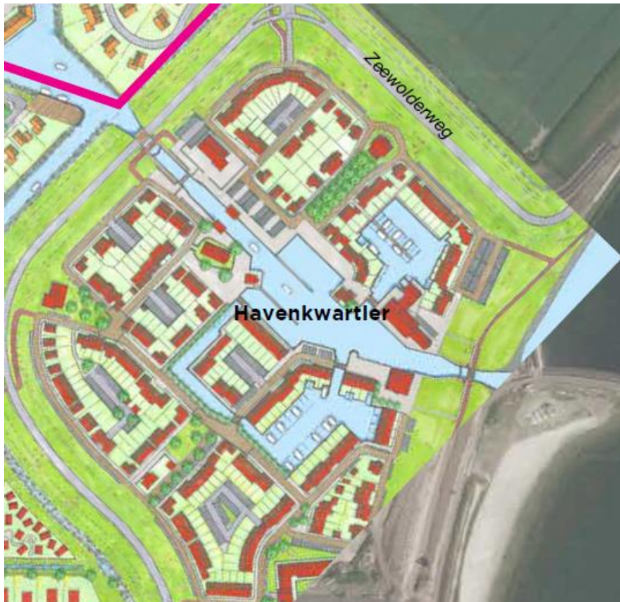
Figuur 2 Beoogde situatie

buitenranden van het plan zijn appartementen in maximaal 5 bouwlagen gesitueerd. De noordoostkant wordt begrensd door het water (Blauwe Diamant) waar een jachthaven gesitueerd is. Qua bebouwing aan deze zijde vindt als het ware een spiegeling plaats van de tegenover gelegen eerste fase van het Havenkwartier. Ook is aan de zuidzijde van het plangebied een insteekhaven met een jachthaven gesitueerd.