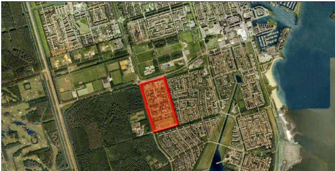
Figuur 1: Locatie plangebied

In de directe omgeving van het plangebied bevindt zich een risicobron die relevant is voor de externe veiligheid: het vervoer van gevaarlijke stoffen per aardgastransportleiding N-570-18. Op basis van het Besluit externe veiligheid buisleidingen (Bevb) kan worden opgemaakt dat het groepsrisico van de aardgastransportleiding verantwoord moet worden.