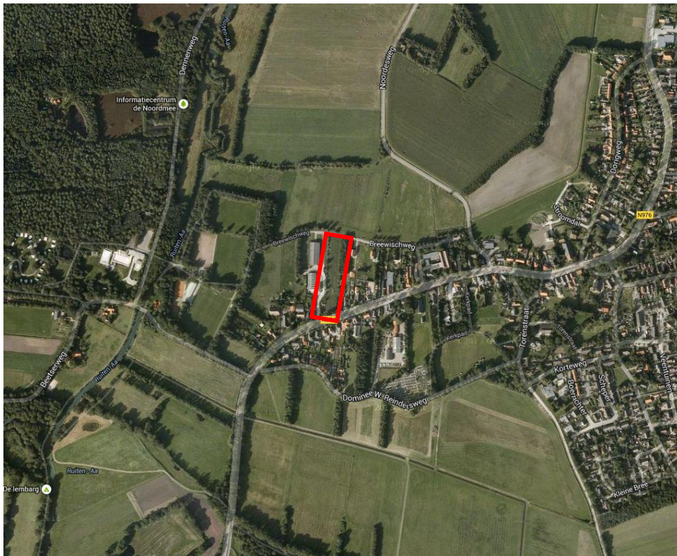
Figuur 1: De ligging van het plangebied. Het plangebied is rood omkaderd (Luchtfoto Google Earth Pro).

Het plangebied ligt tussen Westerkamp nummer 17 en 23 te Sellingen in de gemeente Vlagtwedde, provincie Groningen, (fig. 1).