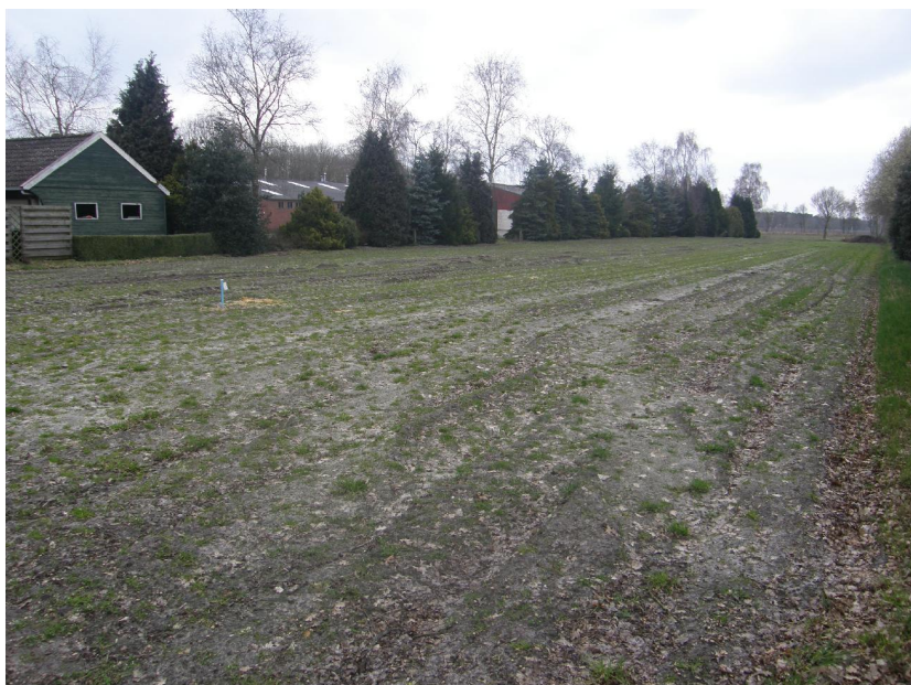
Figuur 2: Impressie van het plangebied.

Het betreft een perceel dat momenteel nog een agrarische bestemming heeft. Er is nauwelijks tot geen begroeiing aanwezig. Het plangebied wordt aan de oost- en westkant deels begrenst door rijen kleine bomen en struiken. Er is geen water aanwezig.