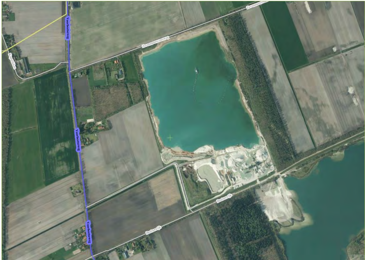
Figuur 2.1 Situering Kremer

De inrichting is gelegen aan de Beetserswijk 10 te Sellingen. De inrichting is niet gelegen op een ingevolge de Wet geluidhinder gezoneerd industrieterrein. Onderstaande figuur 2.1 geeft een overzicht van de situatie zoals deze zich nu voordoet (2016).